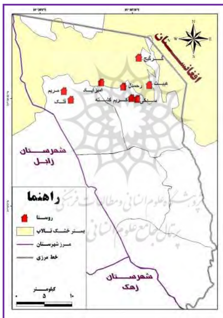
شکل ۴: موقعیت روستاهای تخلیه‌شده بر اثر هجوم ماسه‌های روان.

از یافته‌های دیگر پژوهش، شناسایی روستاهایی است که ماسه‌های روان در تخریب و متروک‌شدن آن‌ها نقش اساسی داشته‌اند. بررسی چگونگی پراکنش هشت روستای شناسایی شده نشان می‌دهد که همه‌ی آن‌ها در قسمت شمالی محدوده‌ی مطالعه و در مجاورت بستر خشک تالاب هامون واقع شده‌اند (شکل ۴). طبق مشاهده‌های میدانی و مصاحبه با ساکنین روستاهای مجاور، مشخص گردید که در این روستاها، حجم عظیم ماسه‌های روان مربوط به فرسایش سالیانه‌ی بستر خشک تالاب هامون سبب مدفون‌شدن اراضی کشاورزی، مسدودشدن کوچه‌ها و معابر روستاها، خسارت‌های به منازل و، نهایتاً، متروک‌شدن آن‌ها شده است.