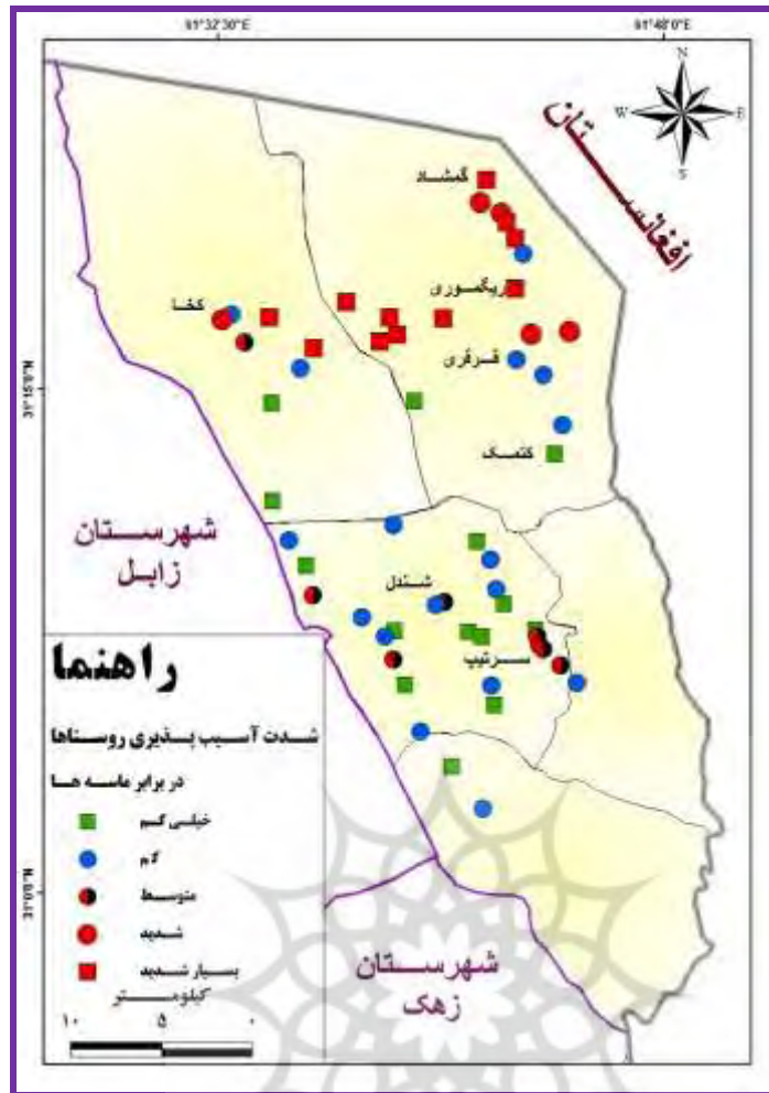
شکل ۱: پراکنش روستاهای محدوده‌ی مطالعه به تفکیک شدت آسیب پذیری.