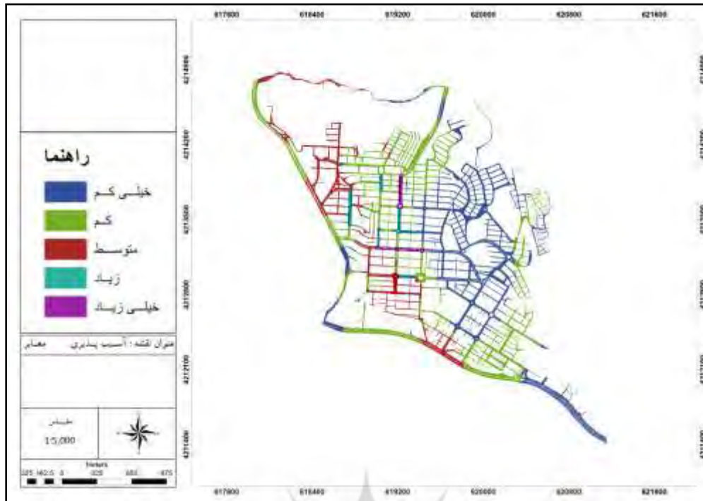
شکل ۲: الگوی توزیع میزان آسیب پذیری شبکه‌ی معابر ناحیه‌ی سه.

مشخصه‌های آسیب‌پذیری شبکه‌ی معابر ناحیه تنها به عوامل اثرگذار به صورت تراکم ساختمانی یا درجه‌ی محصوربودن و تراکم جمعیتی محدود نیست. نتایج همچنین نشان می‌دهد معابر دارای آسیب‌پذیری بالا در فاصله‌ی کمتر از گسل و فاصله‌ی بیشتر از مراکز امدادی و درمانی قرار دارند. همچنین، دارای حجم ترافیک بیشتر و کیفیت ابنیه‌ی پایین‌تر هستند و کاربری‌هایی که به ایمنی بسیاری نیاز دارند (مثل، تأسیسات برق و گاز) در بدنه‌ی آن‌ها وجود دارد.