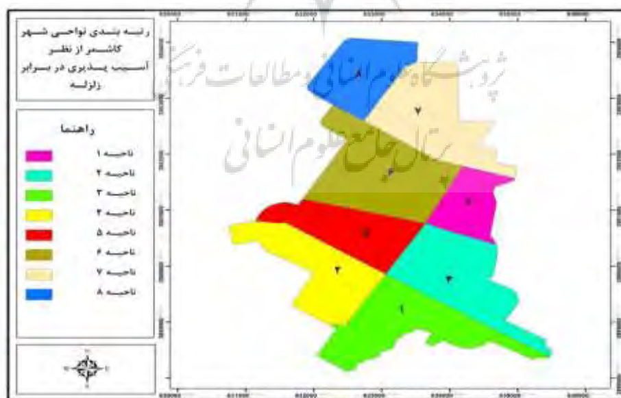
شکل ۲: اولویت‌بندی نواحی شهری کاشمر بر اساس آسیب‌پذیری کالبدی با استفاده از مدل VIKOR

نتایج تحقیق و جدول شماره ۵ مشخص می‌کند که، با توجه به معیارهای مورد استفاده برای ارزیابی آسیب‌پذیری کالبدی نواحی شهری کاشمر، ناحیه‌ی سه بالاترین میزان آسیب‌پذیری و ناحیه‌ی هشت کمترین میزان آسیب‌پذیری کالبدی را در برابر زلزله دارند. شکل شماره ۲ رتبه‌بندی آسیب‌پذیری کالبدی نواحی شهری کاشمر را در برابر زلزله نشان می‌دهد.