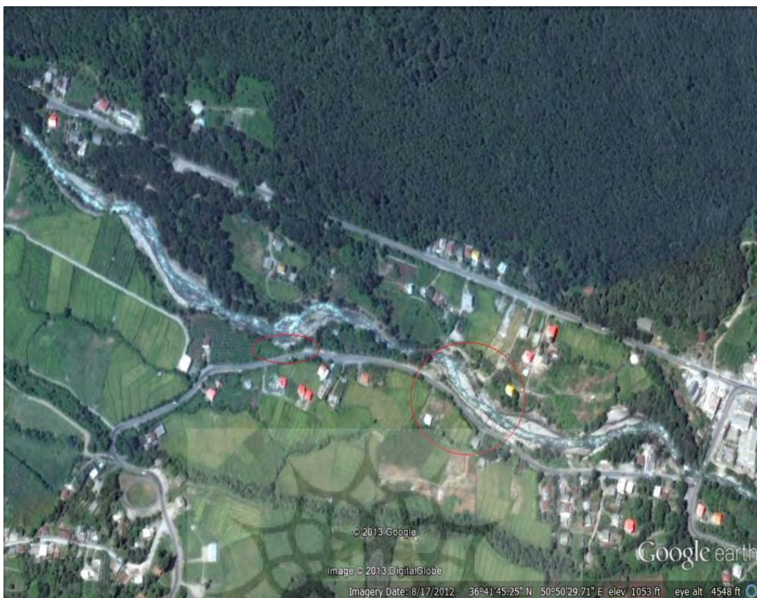
شکل ۳- وضعیت راه‌های ارتباطی که در معرض خطر مستقیم سیلاب قرار دارد (روستای گاویل)