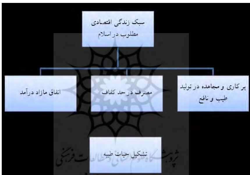
شکل ۲. سبک زندگی اقتصادی مطلوب

در این الگو خانوار با ارائه نیروی کار به بنگاه، کسب درآمد می کند. درآمد خانوار در دو بخش مصرف می شود: بخشی به مصرف در حد کفاف اختصاص می یابد. خانوار از بنگاه به میزان حد کفاف خریداری می کند، بخش دیگری از درآمد به نیازمندان انفاق می شود که نیازمندان با این بخش از درآمد تلاش می کنند تا زندگی خود را به حد کفاف برسانند؛ از این رو نیازمندان تولید مازاد را تقاضا می کنند.