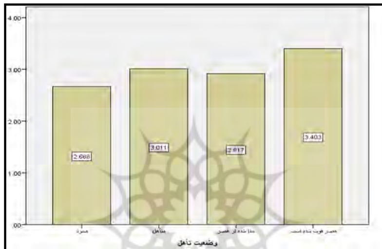
نمودار (3): بررسی تأثیر وضعیت تأهل در میزان امنیت شهروندان

باتوجه به سطح معناداری آزمون افراد در گروه‌های مختلف وضعیت تأهل از لحاظ امنیت تفاوت معنادار دارند و افراد مجرد نسبت به گروه‌های متأهل و همسر فوت شده امنیت کمتری احساس می‌کنند. این تفاوت معنادار است اما میزان امنیت افراد مجرد و مطلقه تقریباً یکسان است. به عبارتی، افراد مجرد نسبت به سایر گروه‌ها امنیت کمتری احساس می‌کنند.