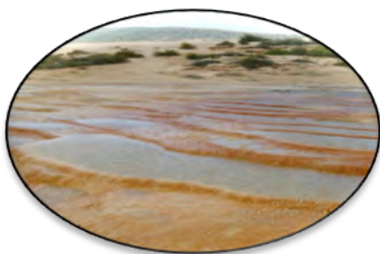
ب) چشمه باداب‌سورت.