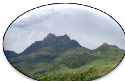
الف) پارک ملی کیاسر.