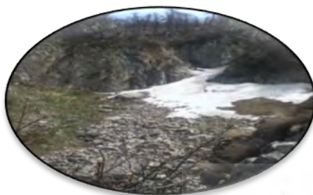
د) یخچال طبیعی شاهدز.