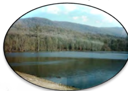
ج) دریاچه الندن (پله).

تصویر ۲. تصاویری از ژئوسایت‌های منطقه بررسی شده.