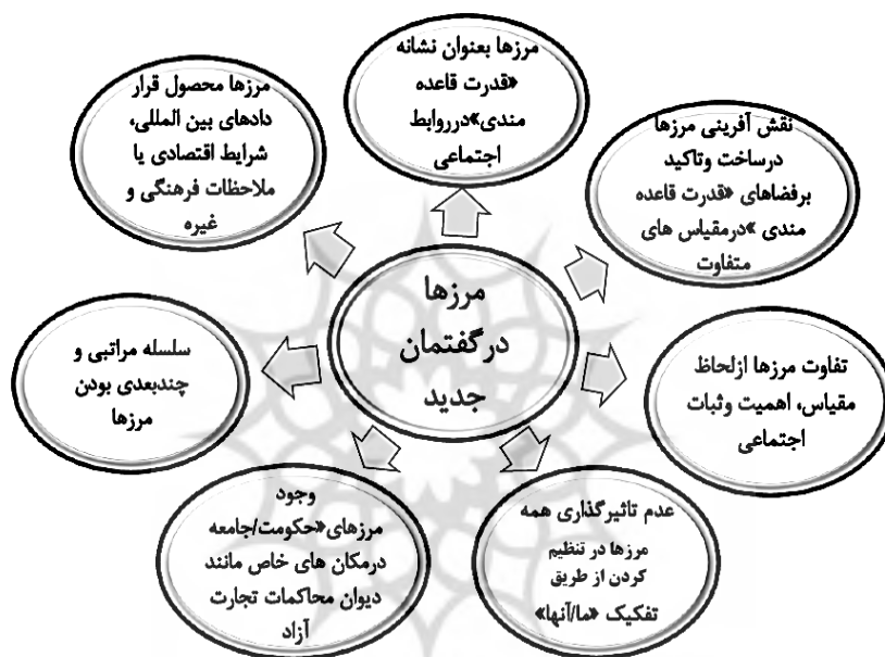
شکل ۲. مرزها در گفتمان جدید

به مباحث مرزهاست. برخلاف مطالعات سنتی مرز، در این مطالعات جدید، مرزها به‌عنوان سازه‌های اجتماعی پویا درک می‌شوند. چنین آثاری، حول محور جدال و مناظره میان ایستایی و تغییر، ثبات و پویایی درمورد موضوع تحدید حدود فضایی ۱ و تولید و بازتولید اجتماعی مرزها سازماندهی شده‌اند. گرایش‌های اخیر به جهانی‌شدن، نشانگر اهمیت خاص چنین توجهاتی به سازمان فضایی زندگی اجتماعی و نیز مسائل مربوط به مرزهاست؛ به‌ویژه اگر برای مثال، با کاهش اهمیت حکومت ملی ارتباط داشته باشد. در این دیدگاه، مرزها به‌مثابه ترسیم‌کننده یا محدودکننده فضا، نه تنها سازه‌ای اجتماعی هستند، بلکه از طریق آن‌هاست که جهان‌های متقاطع، در مجموعه‌های بی‌شمار و روش‌های متداخل قرار می‌گیرند؛ زیرا جهان اجتماعی، سرشار از مرزهای مختلف است؛ بنابراین، سیاست نه‌تنها به مرزهای گوناگون توجه دارد، بلکه به پیگیری دوباره «روابط» میان انواع مرزها نیز می‌پردازد (جانستون، ۲۰۰۱: ۶۸۰؛ آركوس، ۲۰۰۳: ۴۱۸؛ مل و لو، ۲۰۰۵: ۶۴۱).