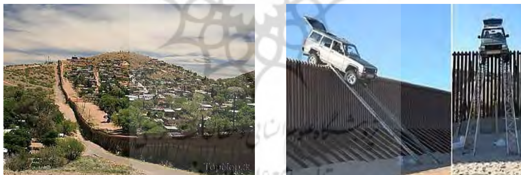
شکل ۳. دیوار مرزی بین آمریکا و مکزیک

مرزهای قلمروی را گاهی به‌صورت مشترک اداره می‌کنند. در این صورت، این مرزها اغلب ایجاد هویت منطقه‌ای را تسریع می‌کنند. این امر، اغلب درباره ویژگی‌های محیطی و فیزیکی، به‌ویژه حوضچه‌های آب در مناطق کم‌آب مانند جنوب غرب آسیا مصداق دارد، اما این موضوع به فعالیت‌های انسانی نیز تسری پیدا کرده است (مانند بازار کار یا پارک‌های صلح که همگی یک زیرساخت فرامرزی ایجاد می‌کنند که سبب ایجاد روابط صلح‌آمیز و عادی‌سازی می‌شود و نه مناقشه و جنگ) (نیومن، ۲۰۰۶: ۱۳۲-۱۳۴). درعین‌حال این فعالیت‌ها تأثیرهای خاصی بر فضای منطقه مرزی می‌گذارند؛ برای مثال، احداث بازارچه‌های مرزی موجب ایجاد تغییرات فضایی و جغرافیایی خاص در زمینه‌های روند حرکت و افزایش جمعیت، حمل‌ونقل، سکونتگاه‌های روستایی و شهری، ارتباطات و تأسیسات عمومی و دایرشدن تعداد زیادی از نمایندگی‌های ادارات دولتی و غیردولتی و... در یک منطقه مرزی خواهد شد (محمدپور و دیگران، ۱۳۸۶: ۱۸-۱۹). نکته دیگر، مدیریت نیروی انسانی در مناطق مرزی است. ساکنان مناطق مرزی، اغلب افرادی هستند که زمینه‌های