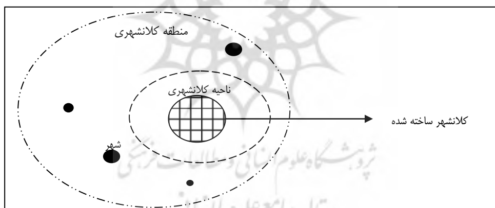
شکل ۱- منطقه کلانشهری

ناحیه کلانشهری: بخشی که در تأثیر مستقیم شهر می باشد که روابطشان قوی و دائمی می باشد. روش مرزبندی سفرهای روزانه می باشد. (ناحیه شهری عملکردی، بخش پسرانه ای داخلی) ۲ منطقه کلانشهری: بخشی که روابط ضعیف تری دارند، ولی ناحیه ای که تحت شهر مرکزی هست تأثیر می گذارد. روش مرزبندی مهاجرت های همیشگی و حوضه آموزش عالی می باشد. (کلان منطقه، بخش پسرانه خارجی) ۳ (Espon, 2012: 12). (شکل شماره ۱).