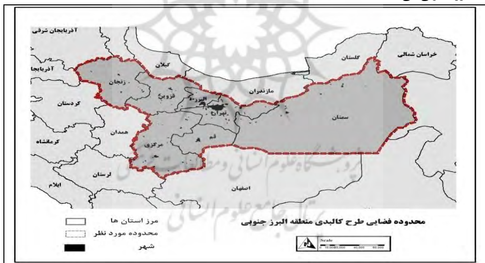
شکل ۳- طرح کالبدی منطقه البرز جنوبی

از آنجا که در هسته مجموعه شهری، کلان شهری چون تهران قرار دارد و نظر به اینکه ساختار فضایی این منطقه تک هسته ای غالب بوده و کشور و منطقه جزء کشور های در حال توسعه است، مناسب ترین واژه و مفهوم برای اطلاق به مجموعه شهری تهران، مفهوم "منطقه کلان شهری" است (Asadi and Zebardast, 2010: 28). منطقه البرز جنوبی ساختار شبکه شهری در مرکز کشور را ارائه می دهد که در راستای شرقی غربی گسترش یافته است. شکل شماره ۳ نمایانگر محدوده فضایی منطقه البرز جنوبی می باشد.