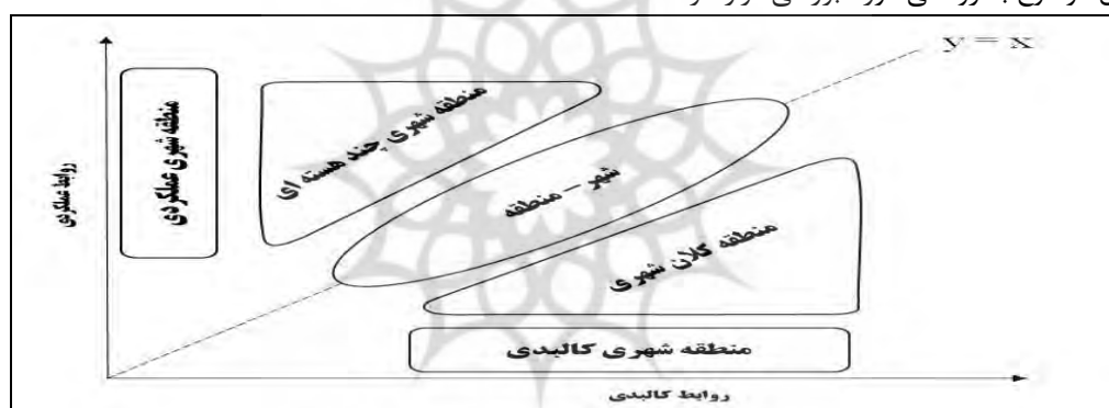
نمودار ۱- دسته بندی پدیده های فضایی بر پایه ماهیت شکل گیری

آن گونه که در پژوهش حاضر نمایان شد، هر یک از مفاهیم سرزمین های شهر محور، برآیندی از روابط عملکردی و کالبدی می باشند که به صورت های مرئی و نامرئی تقسیم می شود. حال آن چه غالباً به عنوان پدیده فضایی مطرح می شود بر گرفته از نگاه صرفاً کالبدی می باشد. هر پدیده فضایی نیز با توجه به میزان تاثیر گذاری عوامل و مؤلفه ها، تعریف پذیر می شود که در نمودار ۱ این موضوع به روشنی مورد بررسی قرار گرفته است.