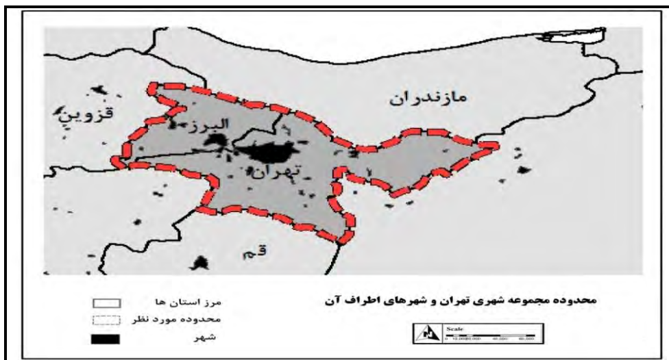
شکل ۲- محدوده مجموعه شهری تهران و شهرهای اطراف آن

از آنجا که در هسته مجموعه شهری، کلان شهری چون تهران قرار دارد و نظر به اینکه ساختار فضایی این منطقه تک هسته ای غالب بوده و کشور و منطقه جزء کشور های در حال توسعه است، مناسب ترین واژه و مفهوم برای اطلاق به مجموعه شهری تهران، مفهوم "منطقه کلان شهری" است (Asadi and Zebardast, 2010: 28). منطقه البرز جنوبی ساختار شبکه شهری در مرکز کشور را ارائه می دهد که در راستای شرقی غربی گسترش یافته است. شکل شماره ۳ نمایانگر محدوده فضایی منطقه البرز جنوبی می باشد.