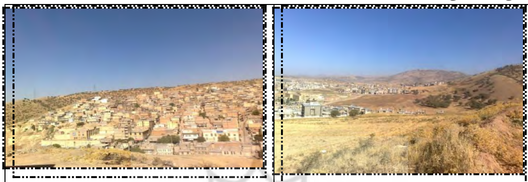
شکل ۲ و ۳ - موقعیت طبیعی شهر جوانرود

بر اساس شواهد، شهر جوانرود به دلیل واقع شدن در دامنه‌ی کوه شاهو از سلسله جبال زاگرس و محصور بودن با تپه‌ماهورهای نسبتاً شیب‌دار، برای گسترش فیزیکی با محدودیت روبه‌رو می‌باشد. در واقع، توپوگرافی در مکان‌گزینی، گسترش و توسعه فیزیکی شهر جوانرود تأثیر به‌سزایی داشته است. زیرا این شهر از جهات مختلف به وسیله ارتفاعات محصور گردیده است. در این راستا، از طرف شمال به تپه‌ها و ارتفاعات شمالی شهر (شکل شماره ۲)، از طرف شرق به تپه‌ها و ارتفاعات شرقی و شمالی، از طرف جنوب به تپه‌ماهورها و اراضی ناهموار و شیب‌دار جنوبی شهر (شکل شماره ۳) و از طرف غرب به تپه‌ها و ارتفاعات غربی محدود می‌باشد.