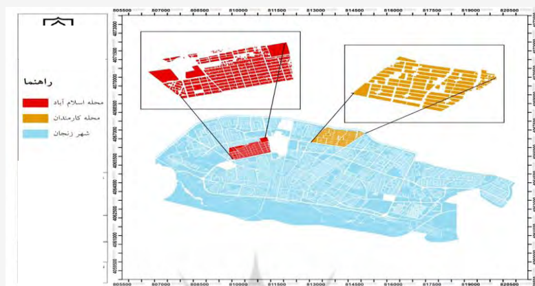
شکل (۱) محدوده و موقعیت محلات کارمندان و اسلام‌آباد در شهر زنجان (۱:۲۰۰۰ شهر زنجان) (نجفی، ۱۳۹۳)