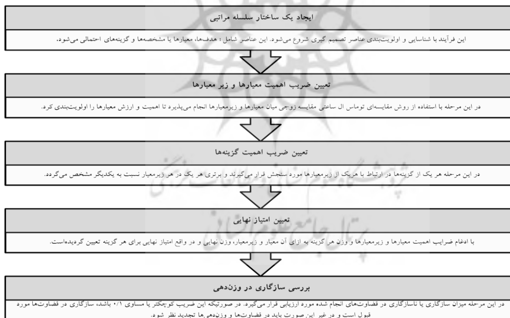
شکل-۲: مراحل مدل فرآیند تحلیل سلسله مراتبی (AHP)