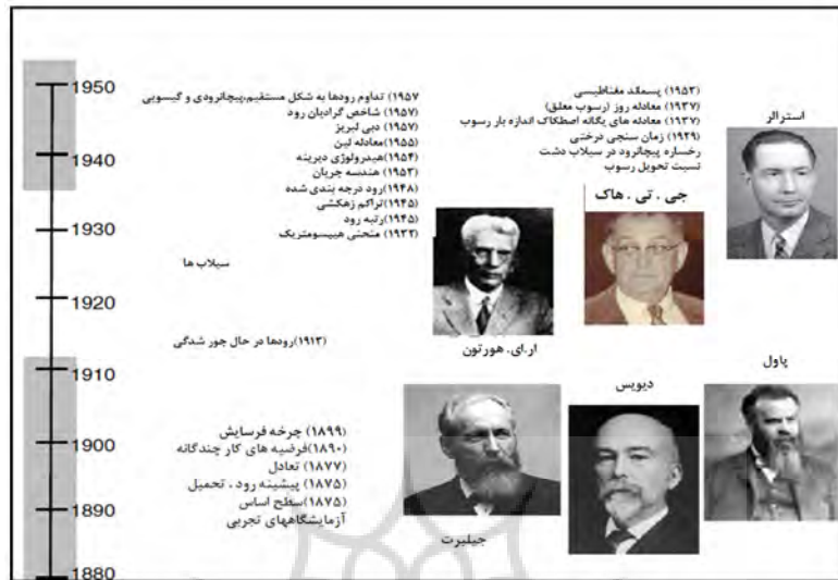
شکل ۱ خط زمانی مدل‌های مفهومی، محیط‌های رودخانه‌ای و ابزارهای مورد استفاده پیش از ۱۹۶۰

فعالیت‌ها در دو دوره متمرکز بودن: از دهه ۱۸۷۰ تا دهه اول قرن بیستم و از دهه ۱۹۳۰ تا دهه ۱۹۵۰.