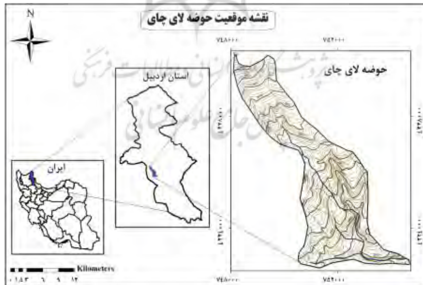
شکل (۱). نقشه موقعیت جغرافیایی حوضه لای چای

حوضه آبخیز لای چای با وسعتی معادل ۱۷ کیلومتر مربع و ۹۴/۱۶۰۲ هکتار یکی از زیر حوضه‌های آق لاقان چای در شهرستان نیر می‌باشد. حوضه لای چای در مختصات جغرافیایی ۳۸ درجه و ۷ دقیقه ۳۸ درجه و ۱۲ دقیقه عرض شمالی و ۴۷ درجه و ۵۰ دقیقه تا ۴۷ درجه و ۵۵ دقیقه طول شرقی، و در دامنه جنوب شرقی کوه سبلان واقع شده است (شکل ۱). حداکثر ارتفاع حوضه ۳۷۰۰ متر، حداقل ارتفاع آن ۲۰۴۰ متر و ارتفاع متوسط حوضه ۲۰۶۰ متر از سطح دریا است. شیب متوسط حوضه نیز ۳۵ درصد می‌باشد. با توجه به داده‌های ایستگاه‌های هواشناسی و روش‌های تعیین اقلیم دمارتن و آمبرژه، اقلیم منطقه نیمه مرطوب سرد و متوسط بارندگی ۳۶۳ میلی متر در سال می‌باشد. از نظر زمین‌ساختی منطقه مورد مطالعه در زون زمین‌ساختی البرز غربی-آذربایجان قرار دارد.