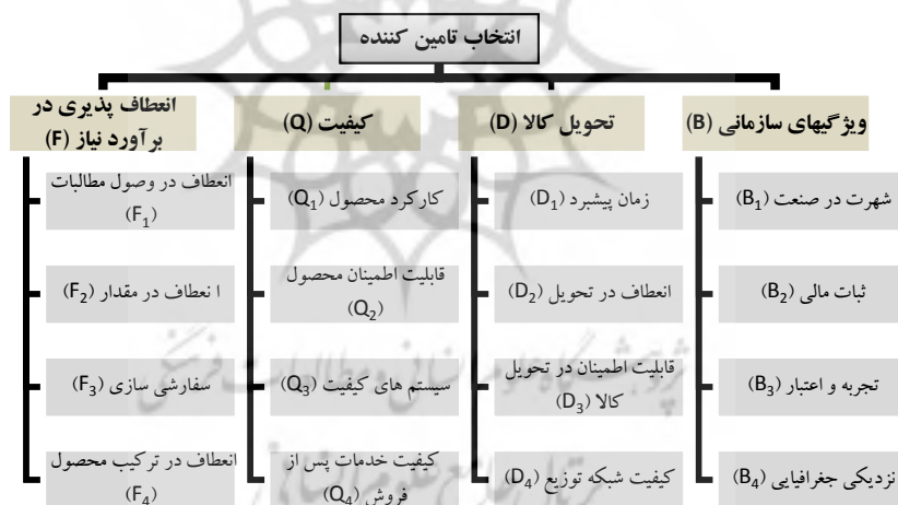
شکل ۲ - سلسله مراتب معیارهای انتخابی

بدین منظور این پژوهش با تکیه بر مدلی ترکیبی برای شناسایی و رتبه‌بندی ۶ تأمین‌کننده ۱ گرانول پی وی سی اصلی مورد نظر این شرکت انجام گرفته است. در فاز اول، با توجه به ادبیات موجود در حوزه معیارهای ارزیابی و انتخاب و نظرخواهی از خبرگان از طریق مصاحبه باز با یک گروه سه نفره متشکل از مدیرعامل، مدیر تدارکات، و مدیر فنی شرکت که براساس نمونه‌گیری هدفمند به روش گلوله برفی انتخاب شدند، معیارها شناسایی شد. با توجه به مجموعه وسیعی از شاخص‌های انتخاب شده، در بخش دوم از این مرحله پرسشنامه‌ای نیمه باز تهیه و غربال‌سازی نهایی توسط ۸ نفر از کارشناسان و مسئولین مرتبط انجام شد. ۲۰ معیار از مهمترین شاخص‌ها استخراج و با توجه به نظر خبرگان و اساتید مربوطه و بهره‌گیری از دسته‌بندی مطالعات موجود اختصاصاً مطالعه لی و آمی [۲۴]، در پنج گروه تقسیم‌بندی شدند. بدین صورت ۱۶ معیار در ۴ دسته معیار کلی (شکل ۲) برای سنجش تابع مطلوبیت خرید، ابتدا وارد مدل می‌شوند و ۴ معیار باقیمانده که قالبی هزینه‌ای دارند به صورت تابع خرید و در مدل چندهدفه وارد می‌گردند.