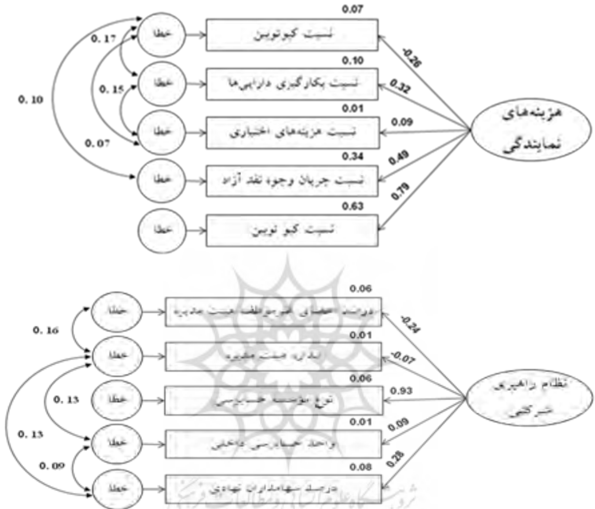
شکل ۲. مدل‌های اندازه‌گیری اصلاح شده هزینه‌های نمایندگی و نظام راهبری شرکتی

در شکل (۲) مدل‌های اندازه‌گیری اصلاح شده بارکنش‌های عاملی آن‌ها ارائه شده است: نظام راهبری شرکتی و هزینه‌های نمایندگی به همراه