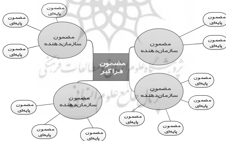
نمودار ۱: ساختار یک شبکه مضمونی (Attride-Stirling, 2001: 388)

مشخص، پایین‌ترین سطح قضایای پدیده را از متن بیرون می‌کشد (مضامین پایه)؛ سپس با دسته‌بندی این مضامین پایه‌ای و تلخیص آنها به اصول مجردتر و انتزاعی‌تر دست پیدا می‌کند (مضامین سازمان‌دهنده)؛ در قدم سوم این مضامین عالی در قالب استعاره‌های (Stirling-Attride, 2001: 388) اساسی گنجانده شده و به صورت مضامین حاکم بر کل متن در می‌آیند (مضامین فراگیر) (Stirling-Attride, 2001: 388)؛ سپس این مضامین به صورت نقشه‌های شبکه تارنما، رسم و مضامین برجسته‌ی هر یک از این سه سطح همراه با روابط میان آنها نشان داده می‌شود. بر خلاف روش قالب مضامین، شبکه‌های مضامین به صورت گرافیکی و شبیه تارنما نشان داده می‌شوند تا تصور وجود هر گونه سلسله مراتب در میان آنها از بین برود، باعث شناوری مضامین شود و بر وابستگی و ارتباط متقابل میان شبکه تاکید شود. در این نوع تحلیل، سعی بر این است که از مضامین پایه‌ای که آشکار و مصرح هستند به سوی مضامین انتزاعی‌تر و کلی‌تر حرکت شود تا به مضمون (یا مضامین) اصلی متن دست پیدا کنیم. (Attride-Stirling, 2001: 3)