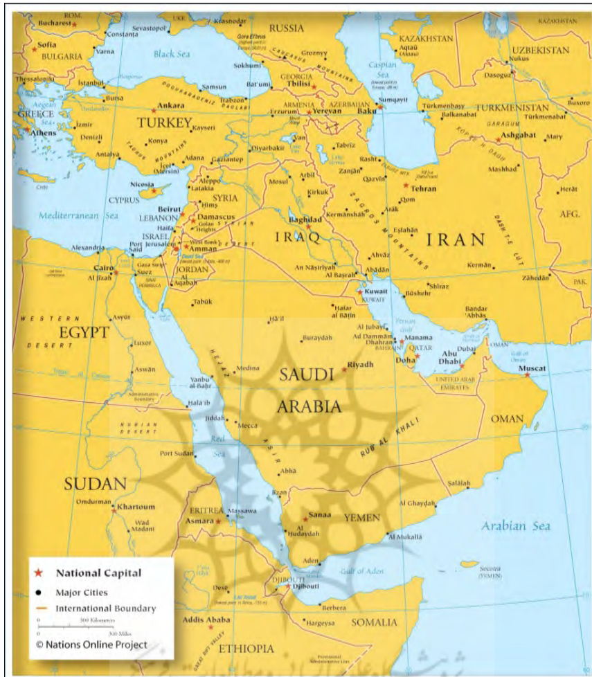
نقشه ۱- موقعیت استراتژیکی سوریه در آسیای غربی و خاورمیانه