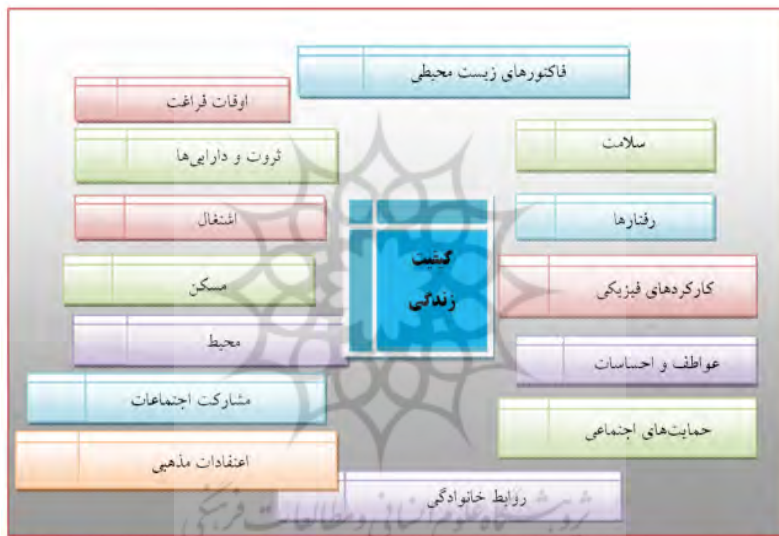
شکل ۲. شاخص‌های کیفیت زندگی

لذا اندیشمندان برنامه‌ریزی اعتقاد دارند، برنامه‌ریزی‌ها باید همسو با بهبود کیفیت زندگی باشند. بهبود کیفیت زندگی می‌تواند زمینه‌های متنوع توسعه مانند توسعه اجتماعی، اقتصادی و کالبدی را دربرگیرد. در این راستا، نواحی روستایی، از فضاها نیازمند ارتقای کیفیت زندگی در جهت کاهش محرومیت جغرافیایی و دسترسی به نیازهای اساسی زندگی است (حیدری ساریان، ۱۳۹۳: ۱۳۲). دولت‌ها از شیوه‌های گوناگون در تلاش برای ارتقای سطح کیفیت زندگی در اجتماعات انسانی به‌ویژه جوامع فقر و روستایی می‌باشند. یکی از مهم‌ترین شیوه‌هایی که در سال‌های اخیر مورد تأکید قرار گرفته است، برقراری عدالت اجتماعی از طریق