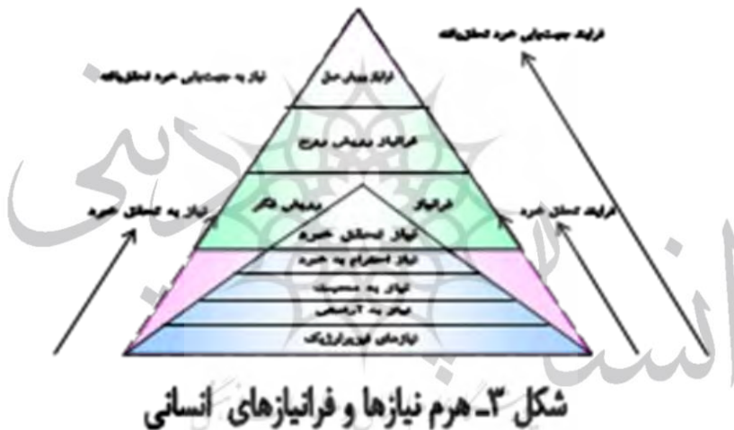
شکل ۳- هرم نیازها و فراتیاها انسانی

با مروری بر آموزه‌های اهل بیت(ع)، می‌توان گفت ادعیه و نیایش‌های اهل بیت(ع) ژرف‌ترین جست‌وجوی زیستی آدمیان است. دست‌یابی به رشد و کمال، درونی‌ترین لایه تحلیلی نیایش‌های بشری است. خواهانی‌های اهل بیت(ع) سامانه‌ای جامع از فرآیندها است.