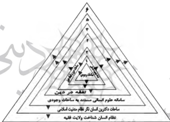
شکل شماره ۴: سطوح ساحات مرتب بر ساحات وجودی انسان و نظریه پردازی مطوف به آن

۵. رخداد مدنیت اسلامی در مقتضیات گوناگونی چونان مقتضیات جهان معاصر ایرانی، حاجت‌مند نوعی الگوی کلان پیشرفت است. ساختار عمومی این مدل عملیاتی کلان مستند به سطوح و ابعاد کلان‌نگر امر انسانی، ماهیت اصیل انسان‌شناخت خویش راه، در سه فصل «نقشه جامع علم»، «نقشه جامع آموزش و پرورش» و «نقشه جامع مهندسی فرهنگی» بیان داشته است. ۶. در سرجمع سطوح و لایه‌های دانشی - تدبیری مبتنی بر انسان‌شناسی پیشرفت، با نگره کلان‌ساحتی به انسان، نظام انسان‌نگر ولایت فقیه توجیه می‌شود.