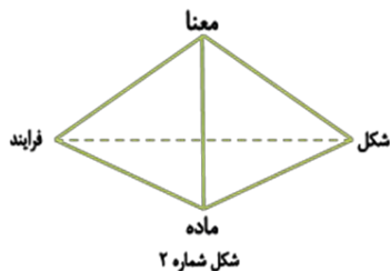
شکل شماره ۲

«چشم‌انداز معنا» به مضمون هدف‌دار فرآیند تغییر، حیات و جهت‌گیری آن نظر می‌افکند. مقررات رفتاری، ارزش‌ها، نیت‌ها، مقاصد، طرح‌ها، راهبردها و روابط قدرت در دنیای امر انسانی در نظام ارزش‌ها، روش‌ها، بینش‌های تغییر فردی، تغییر اجتماعی و آشکارگی آن در عرصه هنر، سامان می‌یابند و به این قرار مضمون جهت‌ی مکتب تغییر را توضیح می‌دهند. پس، فهم کامل فرآیند حیات و تغییر، باید دربرگیرنده ترکیب چهار چشم‌انداز شکل، ماده، فرآیند و معنا باشد (نک: شکل ۲).