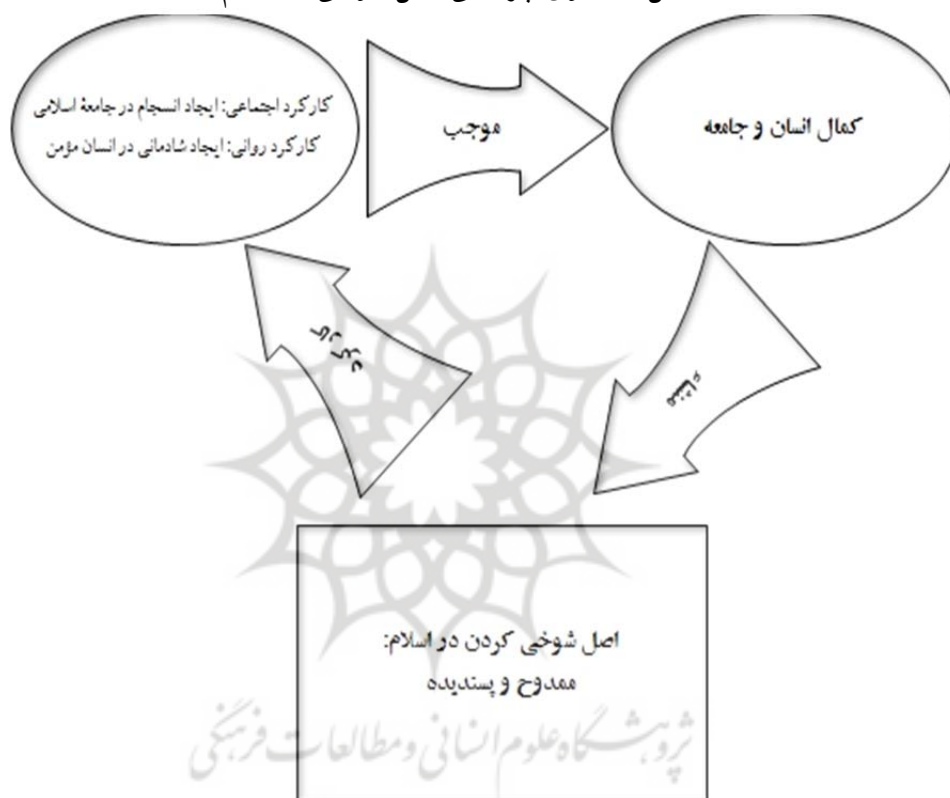
شکل ۱. الگوی چرخشی اصل شوخی در اسلام

طبق این الگو، شوخی کردن امری ممدوح و پسندیده است، این مدح از دو جهت قابل توجیه است: