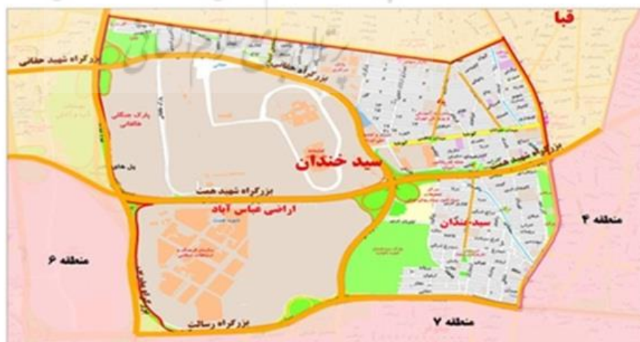
نقشه ۱- محدوده مورد مطالعه