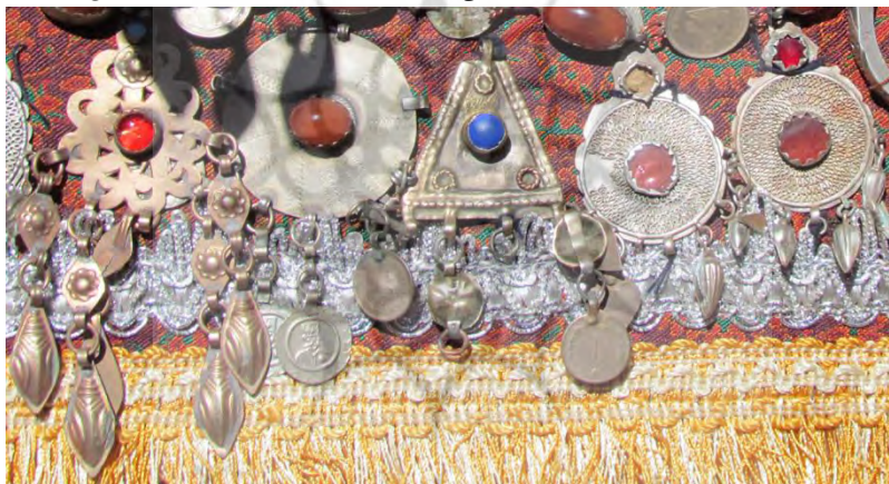
تصویر ۱- تمرکز زیورهای نخل ایبانه بر درخشش، ۱۳۹۱، کاظمی ۱۷

نقوش بیشتر زیورهای نخل ایبانه به شکلی در کنار هم قرار گرفته‌اند که بیشتر، حالتی از توالی دارند. در برخی از آن‌ها، بخشی از نقوش، تقارن ایجاد می‌کنند، ولی حضور عنصری کوچک تقارن کل مجموعه را برهم می‌زند. در مجموع، چنان‌که در دیگر هنرهای تزئینی ایبانه، همچون درب خانه‌ها و رودوزی لباس‌ها هم دیده می‌شود، تأکید اصلی در همه نقوش زیورها بر عنصری درخشان است (نک: تصویر ۱). حرکت و جنس براق فلزها هنگام قرارگرفتن بر نخل یا پیکره انسانی، با انعکاس نور پیرامون، به این درخشش جلوه بیشتری می‌دهد. در بیشتر زیورها، نگین مرکزی، قرمز است و این با پارچه قرمز زمینه، متناسب است. در استفاده زیورها توسط زنان نیز تناسب، در نظر