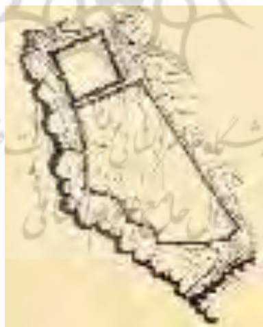
پلان قلعه یزآباد نخجوان

(Nax̄ van ensiklopedyas ,c2, 2005, s356).