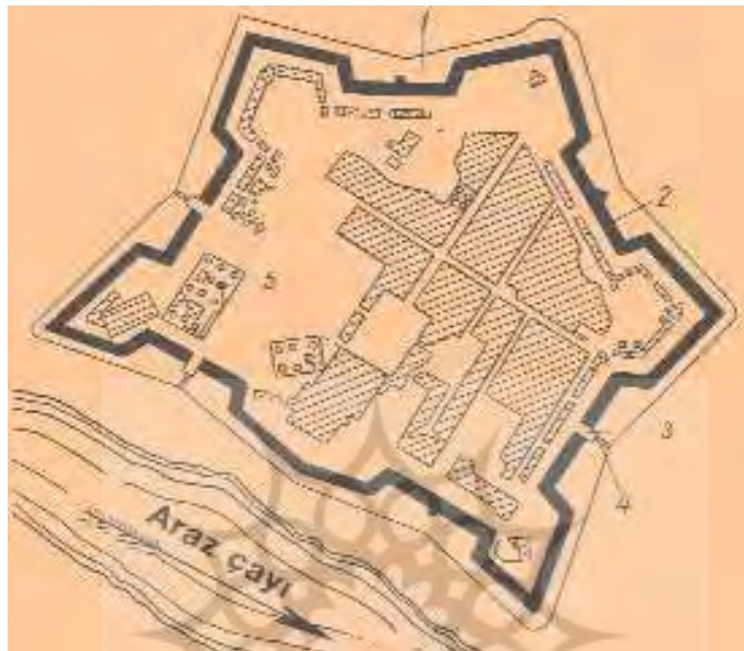
پلان قلعه عباس آباد ۱- خندق ۲- دیوار قلعه ۳- دروازه ۴- پل ۵- چشمه (Naxçıvan ensiklopedyası, c1, 2005, s7).