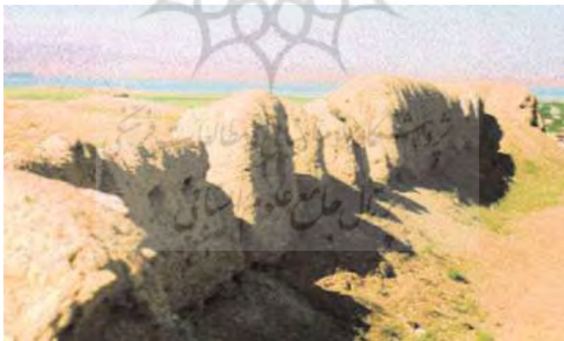
بقایای قلعه یزدآباد نخجوان (Naxçıvan abidli ensiklopediyası 2008, s 225).