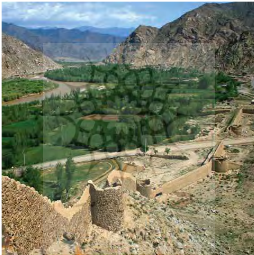
قلعه کوردشت و رود ارس

۱۲۳۳هـ.ق. / ۱۸۰۹م. صورت گرفته و تداوم آن به همت مهندسان ایرانی تحت تربیت همین مستشاران نظامی انجام پذیرفته باشد. مستشاران نظامی انگلیسی که پس از این سال جایگزین مستشاران نظامی فرانسه شدند، نقش نسبتاً جزئی در تکمیل این قلاع را ایفا نمودند و بدین ترتیب معماری نظامی اروپایی برای نخستین بار در ایران رخنه نمود.