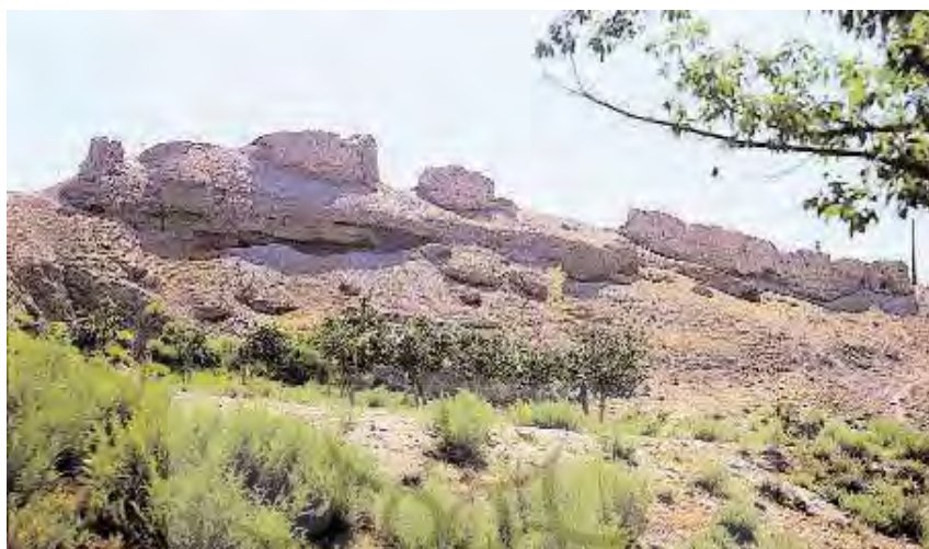
بقایای قلعه یزآباد نخجوان

(Nax̄ van ensiklopedyas ,c2, 2005, s356).