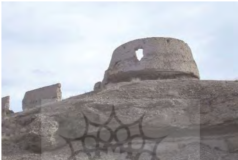
بقایای قلعه یزدآباد نخجوان (Naxçıvan abidli ensiklopediyası 2008, s 225).