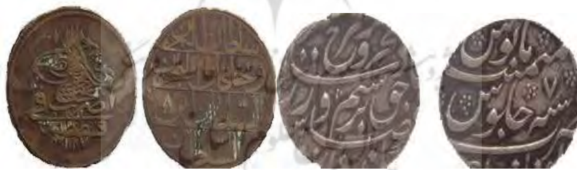
سکه گورکانیان هند سکه سلاطین عثمانی (۱۱۸۷)

سلطان البرین و خاقان البحرین السلطان بن السلطان