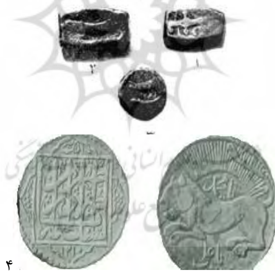
۱، ۲، ۳. (تصویر شمشیر) (ذکاء، ۱۳۴۴: ۱۵)

در تهران ضرب شده است، روی نقش خورشید کلمه‌ی «یا محمد» و روی نقش شیر کلمه «یا علی» نوشته شده است (رایینو ۱۳۵۳: ۱۴۲). به‌رغم این‌که شیر و خورشید جایگاه خاصی در تاریخ و فرهنگ ایران دارد، اما تاکنون بر اساس مستندات و منابع موجود، سکه‌ی غیاث‌الدین کیخسرو قدیمی‌تر از صفویان بوده و سکه‌های ضرب شده در ایران متأثر از سلجوقیان بوده است. بدیهی است چنانچه هدف سلجوقیان در استفاده از این نقش مشخص شود ممکن است گفته‌ی جیمز هال در خصوص منشاء ایرانی داشتن آن به اثبات برسد. «در نزد ایرانیان، شیر نشان هیبت و قدرت و غلبه، و خورشید بر پشت آن نشان طلوع قدرت بوده است.» (سرافرازی، ۱۳۸۹: ۵۱) به هر روی، شیر و خورشید در ارتباط با مفاهیمی چون سلطنت و قدرت الهی به‌کار گرفته شده است. با توجه به ساختار مذهبی حکومت صفوی احتمالاً به‌کارگیری نقش شیر و خورشید بر روی سکه‌های این دوره بیش‌تر صبغه‌ی مذهبی داشته است.