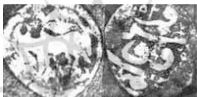
سکه مورخه ۱۰۵۴ ه.ق (مدرسی طباطبایی، ۱۳۵۱)

اسطوره آفرینش جهان به اعتقاد ایرانیان باستان، نخستین حیوان جهان «گاو یکتا آفریده» رنگش سفید و مثل ماه تابان بود (دادور؛ مبینی، ۱۳۸۷: ۱۱۸). در آیین میترا گاو که مظهر ماه و زمستان است به دست مهر، مظهر خورشید و تابستان کشته می‌شود و در نتیجه نباتات متعدد می‌رویند. در آثار باستانی نقش گاو که بر شیر فائق آمده دیده می‌شود (قائینی، ۱۳۸۸: ۱۰۲-۱۰۰). اهمیت و جایگاه گاو در فرهنگ ایرانی و انگیزه قوی هنرمندان در دوره اسلامی و به‌ویژه در دوره صفوی، به دلایل فوق در به‌کارگیری نقش و تصویر گاو بر روی مسکوکات می‌تواند مؤثر باشد. درباره نقش طاووس، ماهی و گاوماهی نیز عقایدی وجود دارد که می‌توان پی‌گیری کرد (ر.ک: همان: ۱۰۴-۱۰۲).