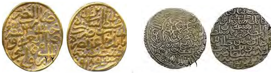
www.coinarchives.com (شماره ۲۷) www.dnecoins.com -۴۶۶۹۲

مدت کوتاهی باشد. بلکه این موضوع یعنی عدم ضرب سکه به‌روش اهل سنت شاید در ارتباط با رقابت دولت نوظهور صفوی در برابر دولت عثمانی باشد.