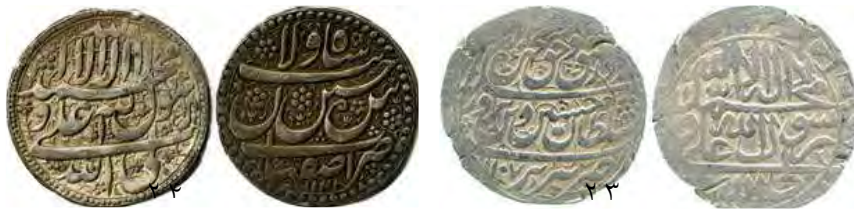
گشت صاحب سکه از توفیق رب مشرقین کلب درگاه امیرالمومنین سلطان حسین: (www.zeno.ru/18998#) (تصویر ۲۵)