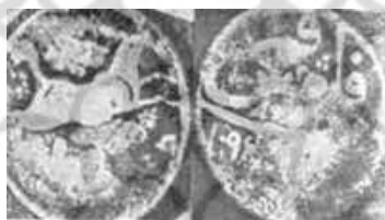
(مدرسی طباطبایی، ۱۳۵۱: ۴۷)

اسب؛ مظهر پاکی، نجابت، آزادی، اندام زیبا، حرکت، سرعت، نیرومندی، خیره‌سری و سرسختی است (حبیبی، ۱۳۸۱: ۱۱۸). اسب سفید یا طلایی در اساطیر ایران شکلی از تیشتر (آورنده آب)، نشانه مردی و نیرومندی است و سوارکار حامل پیام است (صبا، ۱۳۸۴: ۲/۱۳۰-۱۳۱). نقش اسب ریشه در فرهنگ ایران پیش از اسلام داشته و در دوره اسلامی نیز مورد استفاده قرار گرفته است. مغولان برای پیش‌گویی آینده از اسب استفاده می‌کردند (اشپولر، ۱۳۷۴: ۱۷۷). با توجه به این‌که نقش اسب بر روی سکه‌های توراکینا‌خاتون و کیوک و در دوره پس از سقوط حکومت ایلخانی توسط حکومت صفوی چه در نگارگری و چه بر روی مسکوکات مورد بهره‌برداری قرار گرفته است و در دوره حکومت آن‌ها به نوعی مسائل نظامی اهمیت داشت، بنابراین ممکن است استفاده از نقوش اسب بر روی سکه‌های صفوی در معنای واقعی آن و نشانی از جنگاوری و آمادگی نظامی آن‌ها داشته باشد.