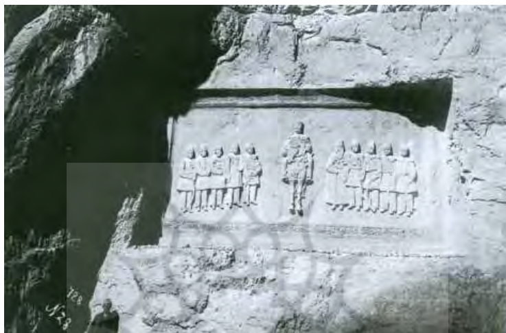
نقش برجسته ناصردین شاه و دوازده تن از وزرا و خواص در کوه هراز به نقل از (حسینی راد، ۱۳۹۱: ۲۹)

10: 1997) و بازدید شاهزادگان قاجار مانند فرهاد میرزا از تخت جمشید همگی نشانگر توجه با تاریخ باستان و گسترش باستانگرایی در این دوره است.