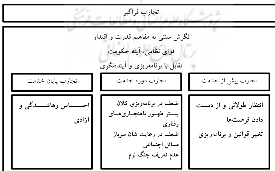
شکل ۲- درون‌مایه‌های اصلی تجارب سربازان دارای تحصیلات تکمیلی از دوره سربازی

قریب به اتفاق سربازان من جمله دارندگان تحصیلات تکمیلی، پس از پایان دوره ضرورت و دریافت کارت پایان خدمت، احساس رهاشدگی می‌کنند؛ رهاشدگی از انتظاری طولانی برای خدمت زیر پرچم که همان طور که گفته شد تبعات آن از سال‌ها قبل از شروع رسمی خدمت سربازی آغاز می‌شود، رهاشدگی از اتمام تعهد نسبتاً طولانی به نظام، احساس آزادی از این‌که زین پس اختیار زندگی فرد، دست خودش است و در تصمیم‌های او به عاملی بیرونی مهمی مانند خدمت وظیفه