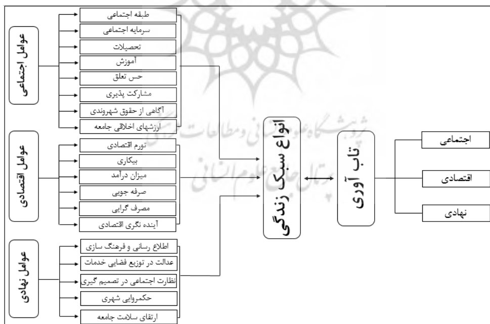
نمودار ۲- مدل مفهومی پژوهش

درباره‌ی تعیین شاخص‌های تاب‌آوری پژوهش‌هایی صورت گرفته است از جمله گادز چالک درآمد پایدار، رشد اقتصادی، فرصت‌های شغلی، توزیع عادلانه‌ی ثروت و درآمد در جامعه و دسترسی به مسکن و خدمات بهداشتی را به عنوان شاخص‌های تاب‌آوری ذکر می‌نماید (گولدشو، ۲۰۰۳: ۱۳۹). ماگوری و هاگان در بحث تاب‌آوری به شاخص‌های اعتماد، رهبری، کارایی جمعی، سرمایه‌ی اجتماعی، انسجام اجتماعی، مشارکت اجتماعی اشاره دارند (میگور و هاگن، ۲۰۰۷: ۱۱). میانگیا پنج نوع سرمایه‌ی اجتماعی، اقتصادی، فیزیکی، انسانی و طبیعی را به عنوان معیارهای ارزیابی اجتماعات تاب‌آور پیشنهاد می‌نماید (مایوناگ، ۲۰۰۷: ۶)؛ بنابراین می‌توان گفت که سبک‌های زندگی متأثر از عوامل به وجود آورنده‌ی آن، موجب تاب‌آوری یا عدم تاب‌آوری محیط‌های برگرفته شده از این سبک‌ها دارند.