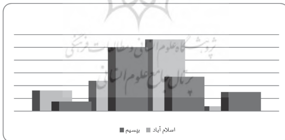
شکل شماره ۲- میانگین سنی سرپرست خانوار

میانگین سنی سرپرست خانوار: از میان پاسخ‌دهندگان (۵۰٪) سرپرست خانوار آن‌ها، در گروه سنی ۴۰-۵۹ سال قرار گرفته است، بعد از آن گروه دوم بوده که (۲۷٫۵٪) خانوارها را در برگرفته و کمترین درصد نیز مربوط به گروه ۶۰-۹۰ سال بوده که (۷٫۵٪) را شامل شده است. ارزیابی وضعیت سنی سرپرستان خانوار در منطقه اسلام‌آباد، نتایج متفاوتی را نشان داده است به طوری که بیشترین گروه سنی (۵۶٫۲٪) را افراد ۳۰-۳۹ سال در برگرفته است و کمترین نیز مربوط به گروه دوم شده است. ارزیابی تطبیقی دو منطقه از لحاظ میانگین سنی سرپرست خانوار نشان داده است که جمعیت ساکن در اسلام‌آباد زنجان، نسبت به منطقه بیسیم جوان‌تر بوده و گروه سنی دوم، بیشترین فراوانی را از میان پاسخ‌گویان داشته است، نتایج بیشتر در نمودار شماره (۱) نشان داده شده است.