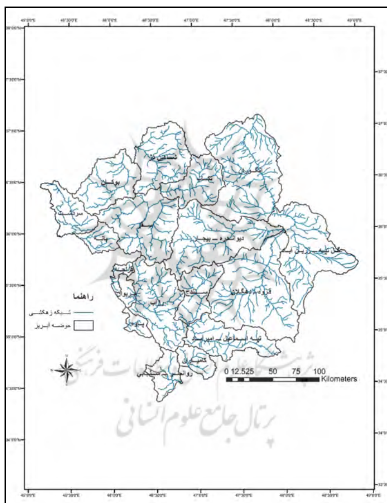
شکل ۱: نقشه موقعیت محدوده و حوضه‌های مورد مطالعه

شرق آن در زون ایران مرکزی (سندج- سیرجان و سهند- بزمان) با لیتولوژی غالباً دگرگونی و آتشفشانی واقع شده است. از نظر پوشش گیاهی غرب منطقه دارای پوشش جنگلی است (جزیره‌ای و همکاران، ۱۳۹۲). بر اساس ویژگی‌های توپوگرافی و هیدرولوژی سطحی و تحقیقات قبلی ۱۸ حوضه در این محدوده جغرافیای شناسایی شدند که ۸ حوضه در داخل استان کردستان (قروه، بانه، سفز، دیواندره، سندج، رزآب، قزلچه و مریوان) و ۱۰ حوضه مشترک با دیگر استان‌ها (انگوران، بوکان، گل‌تپه، کامیاران، پاوه، روانسر، شاهین‌دژ، سردشت، تپه‌اسماعیل و تکاب) است. تمام این حوضه‌ها در این تحقیق مورد مطالعه قرار گرفته است (شکل ۱).