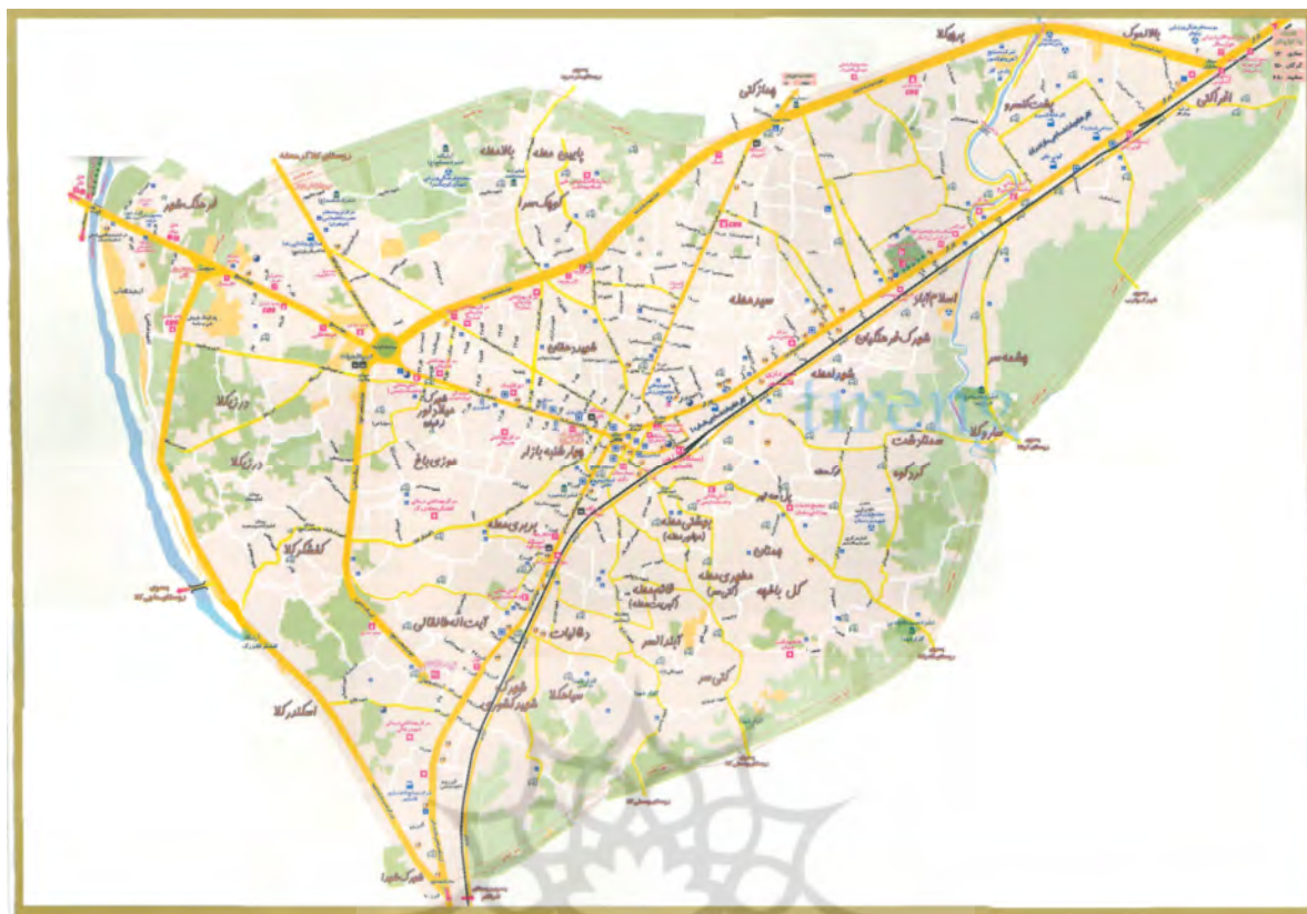
شکل ۱. نقشه شهر قائم شهر