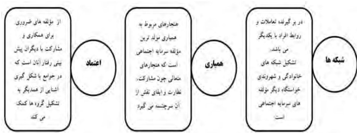
شکل (۲) مفاهیم اساسی تعریف سرمایه اجتماعی از دیدگاه رابرت پوتنام