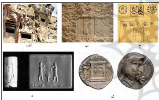
لوح ۱. شاه نشسته بر تخت با گل لوتوس در دست

نگارنده بر این عقیده است که با استقلال فارس در سلطنت وهوبرز نمادها و نقوش جدیدی که یادآور قدرت مطلق شاهان هخامنشی است، در سکه‌ها ظاهر می‌شود و این ظهور نمادهای جدید میسر نمی‌شود مگر آنکه بیگانگان در قلمرو فارس فاقد قدرت باشند اما اینکه نقوش سکه‌های فرترکه با سلسله دوم فارس تفاوت محسوسی دارند، نگارنده ذهن خوانندگان را به این موضوع معطوف می‌دارد که تغییر نقش پرچم در سکه‌ها و نمادهای جدید مانند تاج، نقش حیوانات و ... در سکه‌های نسل دوم یادآور خاندان جدیدی در فارس است که خود را نه از نسل فرترکه بلکه در موازات با آنها و از نسل شاهان قدرتمند هخامنشی می‌دانند.