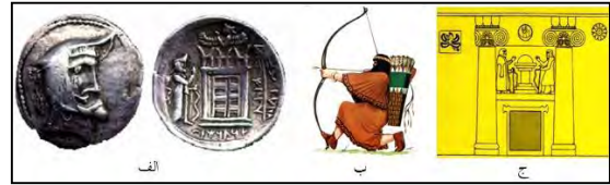
لوح ۳. کمان

لوح ۲- نقش نیایشگر : الف- گوردخمه اسحاق‌وند. ب- گوردخمه دکان داود. ج- گوردخمه قیزقاپان (سرفراز، ۱۳۸۰، ۶۹). د- مهر دوره هخامنشی (امیری نژاد، ۱۳۹۱، ۱۶۴). ی- سکه اردشیر اول (موزه بانک سپه شماره ۱۰۸۷۶)