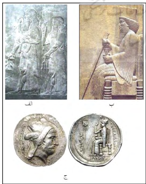
لوح ۲. نقش نیایشگر

جهانداری ساسانی به دنیا عرضه شود. در این راستا می‌توان ادعا نمود که نمادهای سیاسی و مذهبی به کار رفته در سکه‌های فرترکه به سان هم معنی و مفهوم می‌یابد.