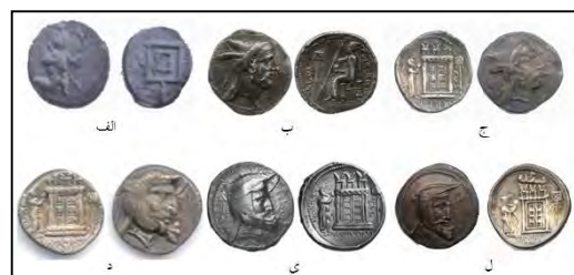
لوح ۶. پرچم

لوح ۱- شاه نشسته بر تخت با گل لوتوس در دست : الف- نقش برجسته خورس آباد (مجیدزاده، ۱۳۸۰). ب- داریوش