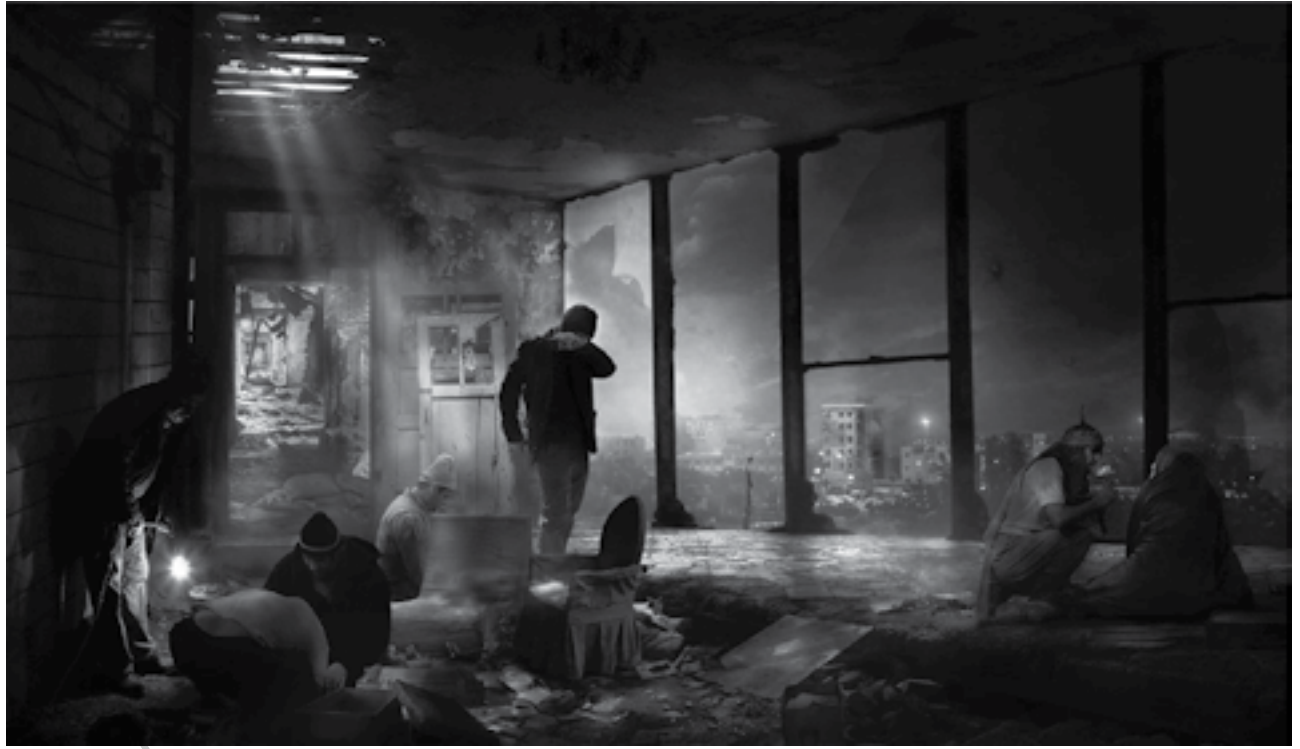
مجید گورنگ بهشتی - ایران