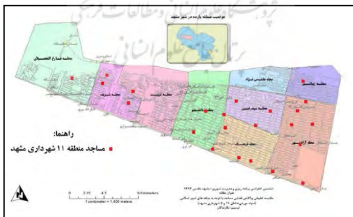
نقشه ۲ - پراکنش فضایی مساجد در محلات نه گانه منطقه ۱۱ شهرداری مشهد

اما مناطق خالی و فاقد مسجد نیز در سطح محله همچنان وجود دارد و به نظر می‌رسد مناطق شرقی و جنوب غربی این محلات اگر بخواهند به نزدیکترین مسجد مراجعه کنند باید حداقل ۲/۵ کیلومتر را طی کنند. محلات فرهنگ و شریف نیز با توجه به مساحت‌های مشابه وضعیت یکسانی دارند. در این دو منطقه ۳ مسجد وجود دارد که البته نوع پراکندگی در منطقه فرهنگ مناسب به نظر نمی‌رسد و باید در مناطق مرکزی، شرقی و شمال نیز مسجد احداث گردد.