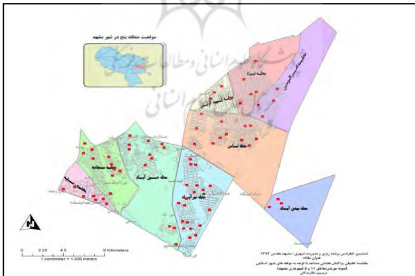
نقشه ۳- پراکنش فضایی مساجد در محلات نه گانه منطقه ۵ شهرداری مشهد

همانگونه که در نقشه شماره ۳ نیز مشخص است در فضاهای مسکونی منطقه ۵ کمتر بلوکی دیده می شود که در فاصله ۱ کیلومتری از مسجد قرار داشته باشد و بهترین وضعیت پراکندگی را در میان محلات منطقه ۵ شهرداری مناطق امیرالمومنین(ع)، مهرآباد و مهدی آباد دارند. در این محلات مساجد به خوبی پراکنده هستند و شهروندان راحت تر می توانند به این مساجد دسترسی پیدا کنند. البته دیگر محلات منطقه نیز عملکرد رضایت بخشی را داشته اند و هم از نظر تعداد و هم از نظر پراکندگی در سطح محلات وضعیت نسبتاً مطلوبی را ارائه داده اند.