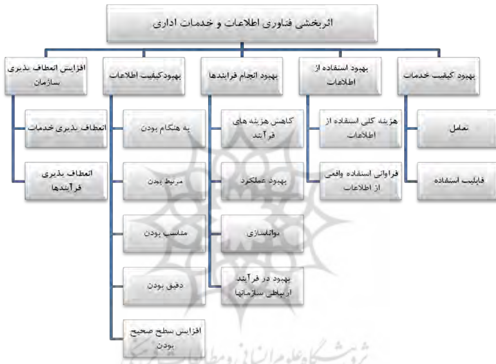
نمودار ۱. مدل مفهومی تحقیق

۰/۵۰ محاسبه گردیدند. بارهای عاملی به دست آمده از ۰/۵۸۰ تا ۰/۹۱۵ است. مقدار میانگین واریانس استخراج شده (AVE) نیز که میزان اعتبار همگرا را می‌سنجد در تمامی متغیرها بیشتر از ۰/۵۰ است که مقدار قابل قبولی در جهت تأیید اعتبار همگرا تلقی می‌شود. مقدار میانگین واریانس استخراج شده در بهبود کیفیت خدمات برابر با ۰/۵۲ در بهبود کیفیت اطلاعات ۰/۶۴، در بهبود در استفاده از اطلاعات ۰/۶۲، در بهبود فرآیندها ۰/۵۹ و در انعطاف‌پذیری سازمان ۰/۶۵ است. پایایی متغیرها از طریق روش همسازی درونی و ارزیابی مقدار آلفای