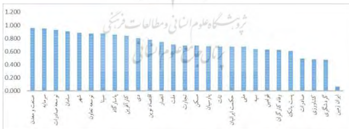
شکل (۲): رتبه‌بندی متوسط کارایی هزینه بانک‌های داخلی کشور طی دوره ۱۳۷۹-۱۳۹۱

از جدول (۱) مشاهده می‌شود که ارقام کارایی هزینه تمامی بانک‌های کشور طی دوره ۱۳۷۹-۱۳۹۱ از روند صعودی منظمی برخوردار بوده است. همچنین از شکل (۲) مشاهده می‌شود که بانک صنعت و معدن که یک بانک تخصصی دولتی است، بالاترین متوسط کارایی (۹۵/۴ درصد) را طی دوره مورد بررسی داشته است و پس از آن بانک (خصوصی) سرمایه و بانک (تخصصی دولتی) توسعه صادرات، به ترتیب با متوسط‌های کارایی ۹۴/۸ و ۹۲/۹ درصد قرار دارند. همچنین کمترین میزان متوسط کارایی (۶/۷ درصد) متعلق به بانک خصوصی ایران زمین است که فاصله بسیار زیادی با بانک‌های دیگر دارد؛ در واقع به نظر