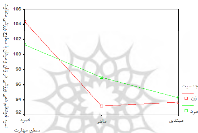
نمودار ۱. مقایسه میانگین خودتنظیمی ورزشی در زنان و مردان خیره، ماهر و مبتدی

شد بین خودتنظیمی ورزشی زنان و مردان در سطح ورزشی خیره تفاوت معناداری وجود ندارد اما مردان در سطح ورزشی ماهر خودتنظیمی ورزشی بهتری نسبت به زنان در سطح ورزشی ماهر داشتند. بین خودتنظیمی ورزشی زنان و مردان در سطح ورزشی مبتدی تفاوت معناداری وجود نداشت. زنان و مردان در سطح ورزشی خیره به طور معنادار دارای