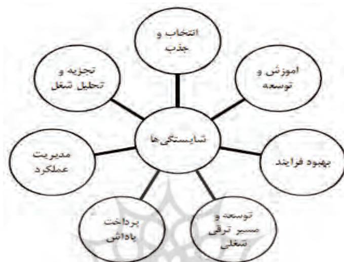
شکل ۱: رابطه شایستگی با زیر سیستم‌های منابع انسانی