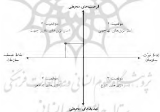
نمودار 2 تعیین موقعیت و استراتژی عمده سازمان بر پایه تحلیل نمودار SWOT

در چنین شرایطی، توصیه می‌شود سازمان با استفاده از «استراتژی‌های تغییر جهت» از مزیت‌های نهفته در فرصت‌های محیطی در جهت جبران نقاط ضعف خود بهره‌گیرد [17].