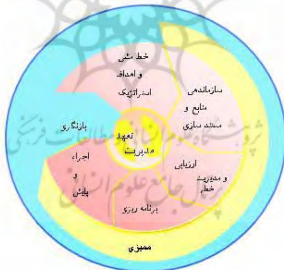
شکل 1 شمای روابط بین عناصر کلیدی نظام مدیریت ایمنی، بهداشت و محیط زیست

در دهه‌های اخیر، تمایلات فزاینده‌ای در به‌کارگیری مدیریت استراتژیکی سازمان‌ها شکل گرفته و مدل‌های گوناگون و متعددی از مدیریت استراتژیک پیشنهاد شده است [4]. برنامه‌ریزی راهبردی، رسیدن از وضعیت موجود (مأموریت سازمان) [5، صص 54-69] به وضعیت مطلوب را که به چشم‌انداز سازمان اشاره دارد، تشریح می‌کند [6]. همچنین چشم‌اندازها بر مبنای آرمان‌ها و ارزش‌ها و با توجه به بررسی محیط خارجی و محیط ملی شکل می‌گیرند [2، صص 239-227]. استراتژی برنامه‌ای است که نحوه آرایش منابع، محصولات، فرایندها و سیستم‌ها را برای شرکت‌ها به منظور سازگاری با محیط خود برای توسعه مزیت‌های رقابتی معین می‌کند [7]؛ [8]. نظام مدیریت بهداشت، ایمنی و محیط زیست، نظامی مدیریتی بر پایه 7 عنصر کلیدی است که در شکل 1 عناصر این نظام به صورت شماتیک نشان داد [9].