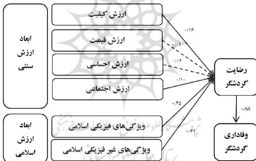
شکل ۲. مدل مفهومی پژوهش در حالت ضریب مسیر استاندارد

نتایج به‌دست‌آمده از تحلیل مسیر و آزمون فرضیه‌های پژوهش به‌صورت خلاصه در جدول ۵ آورده شده است.