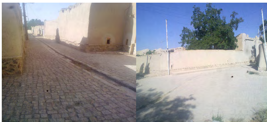
شکل ۴: نمونه‌هایی از بازسازی فضای فیزیکی روستا (اعمیانی‌سازی: gentrification)