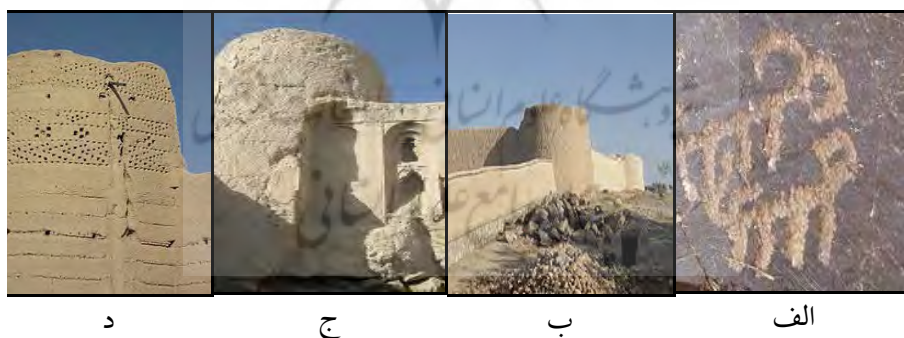
شکل ۲: تصویر برخی از آثار معماری و باستانی روستای دماپ

مهم‌ترین آثار و جاذبه‌های باستانی، تاریخی و فرهنگی روستا مشتمل است بر: - سنگ‌نگاره‌های باستانی یا هنر صخره‌ای در کوه‌های دماپ با قدمتی تا چندین هزار سال قبل از میلاد (شکل شماره ۲- الف)، - کاروان‌سرای سنگی و چهار ایوانی شاه عباسی جلوگیر (شکل شماره ۲ - ب) با میان‌سرا و حیاط روباز با بیش از چهار سده سابقه که تا روزگار قاجار دارای راه‌دار بوده که هزینه آن از کاروان‌ها تأمین می‌شده و با شماره ۹۰۴۷ در فهرست آثار ملی ثبت شده است، - قلعه‌های دماپ؛ شامل قلعه سنگ که قدمت آن به اواخر روزگار اشکانیان و اوایل دوره ساسانی می‌رسد، قلعه ساسانی که هنوز بلندای دیواره‌های آن به پنج متر می‌رسد، قلعه درویش بیگ (شکل شماره ۲ - ج) مربوط به دوره صفوی و قلعه نو دماپ (شکل شماره ۲ - د)، یکی از بزرگ‌ترین و سالم‌ترین قلعه‌ها در میانه روستا، بر جا مانده از دوره فتحعلی- شاه که کف آن یکپارچه از سنگ ساخته شده است. تصاویر شکل شماره ۲، نمایی از این آثار را نشان می‌دهد.