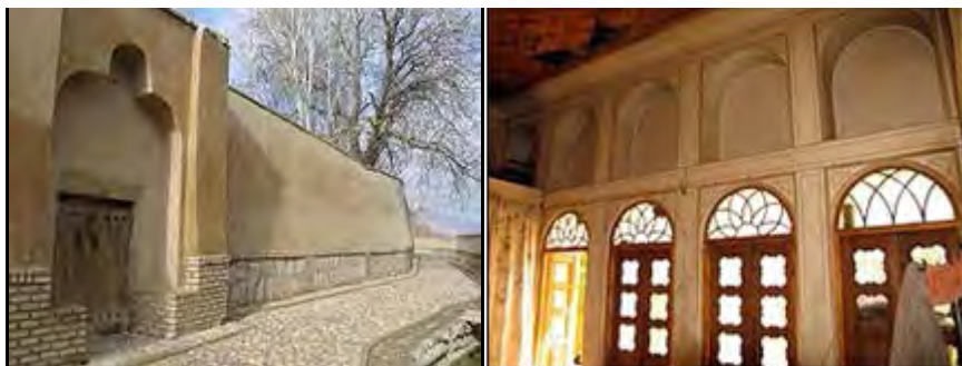
الف) یکی از اتاق‌های عمارت ب) درب عمارت در یکی از کوچه‌های سنگفرش روستا

- عمارت دماب (شکل شماره ۳)؛ کوشکی زیبا و کهن که خانه کدخدا بوده، دارای معماری قاجاری است و هنوز شکوه خود را از دست نداده است.