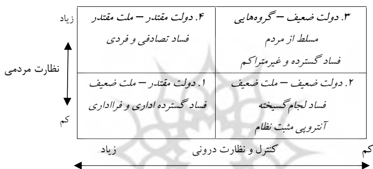
شکل ۱. ماتریس نظارت نظام، نظارت ملت.

۱. سیاسی: با توجه به دو معیار موازنه قدرت میان دولت‌ها و ملل تحت اداره آنها ۴ نوع نظام دولتی و عمومی ایجاد شده است: