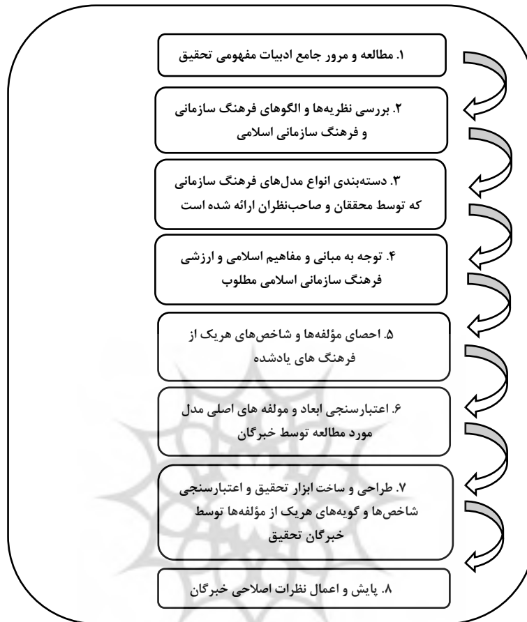
شکل ۲. گام‌های کلی پژوهش