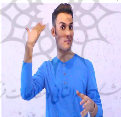
شکل (۴) اشارهٔ مربوط به گذشته با توجه به حالت صورت (بالا رفتن ابروها و باز شدن چشم‌ها)

(۷) "ب ا د و س ت م ن غ ذ ا خ و ر د ن" (اشارهٔ تمام شدن). "با دوستم رفتیم غذا خوردیم (عمل به پایان رسیده است)."