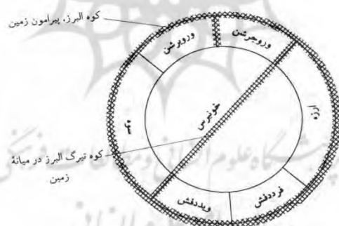
شکل ۱. موقعیت اقلیم‌های هفت‌گانه روی زمین در اسطوره‌های ایرانی (بهار، ۱۳۸۹: ۱۴۱).

اساطیر زردشتی معتقدند که دو نیمکره مسکونی (بالا) را کوهی به اسم البرز فراگرفته و در وسط زمین هم کوه دیگری است به اسم تیرگ البرز که زمین را به دو نیم می‌کند. علت به وجود آمدن شب و روز وجود کوه تیرگ است، به این ترتیب که خورشید وقتی از شرق بلند می‌شود، به علت وجود تیرگ البرز که خیلی بلند است، فقط می‌تواند اقلیم شرقی، دو اقلیم جنوبی و نیم اقلیم جنوب شرقی خونیرس را روشن کند. وقتی عصر از کوه تیرگ می‌گذرد یعنی خورشید در غروب فرومی‌رود، این سه اقلیم و نصفی که یاد کردیم تاریک می‌شود و سه اقلیم و نیم دیگر زمین روشن می‌شود (بهار و شمیسا، ۱۳۸۸: ۹۸). واقعاً جای بسی شگفتی است که در اساطیر ایرانی وجود شب و روز در دو نیمکره زمین به این دقت و ظرافت بیان شده است. کشوری که در شرق است، «ارزه»، آنکه در غرب است، «سوه»، دو پاره که در بخش جنوبی قرار می‌گیرند، «فرددفش» و «ویددفش» و دو پاره که در بخش شمالی قرار می‌گیرند، «وروجرشن» و «وروبرشن» خوانده شده است. موقعیت اقلیم مرکزی یا همان خونیرس در مقایسه با اقلیم‌های دیگر به همراه کوه البرز و کوه تیرگ البرز در شکل زیر به نمایش گذاشته شده است: