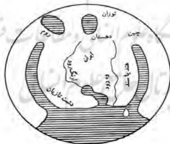
شکل ۳. نقشه آب‌ها و سرزمین‌ها در اسطوره‌های ایرانی (بهار، ۱۳۸۹: ۱۴۴).

اگر به این نقشه توجه کنیم، نقشه‌ای از جهان را می‌بینیم که ایران در مرکز آن قرار دارد و آفریقای شرقی در غرب آن و آسیای شرقی - جنوب شرقی در شرق آن است. دریای فراخکرد اقیانوس هند است و دو شاخه فراخکرد خلیج بنگال در شرق نقشه و دریای سرخ در غرب آن است. کمرو، دریای خزر و سیاه‌بُن همان دریای سیاه و مدیترانه است. دو دریای پوئیدیک و سدویس نیز به ترتیب خلیج فارس و دریای عمان است. کوه تیرگ البرز می‌تواند بر این اساس، با رشته کوه‌هایی که از آلتائی و تیانشان شروع می‌شود و به هندوکش و البرز در شمال ایران می‌رسد و از طریق کوه‌های آسیای صغیر و غرب عربستان و یمن به کوه‌های حبشه در آن سوی دریای سرخ منتهی می‌شود، تطبیق یابد (همان: ۱۴۳). در شکل زیر نیز می‌توان جای آب‌ها را در رابطه با اقلیم‌های هفت گانه زمین مشاهده کرد: