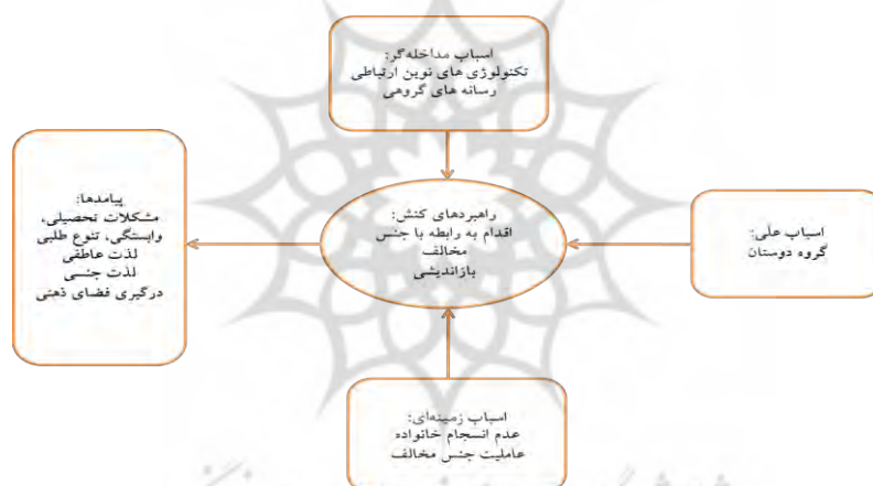
نمودار ۲. مدل پارادایمی تجربه نوجوانان از اسباب، تعاملات و پیامدهای ارتباط با جنس مخالف