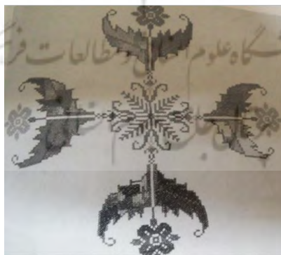
تصویر (۱۰) - نقش نمادین چهار بال شاهین در قالب صلیب