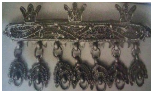
تصویر(۱۱)- نقش هلال ماه و ستاره بر روی موبند نقره‌ای در هنر ملیه‌کاری ایل سنگسری