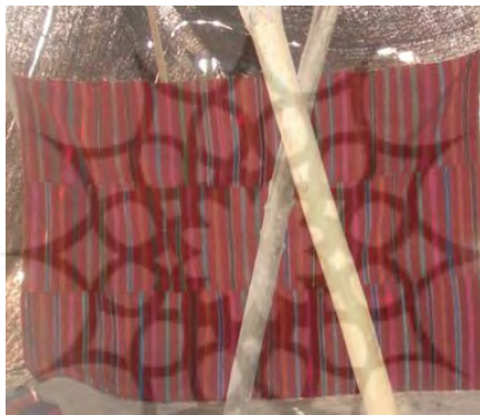
تصویر (۹) - نقش محرمات بر پارچه ابریشمی

خودنمایی کنند. امروزه زنان هنرمند ایل سنگسری نقش هلال ماه و ستاره را بر روی زیورآلات خود از جمله موبند و گردن‌بند نقره‌ای حک می‌کنند (نک: تصویر ۱۱). در زمان ساسانیان معابد و آتشکده‌های فراوان در نقاط مختلف ایران برای پرستش ایزدبانوی آب‌ها بر روی چشمه‌های آب ساخته شدند که بازمانده یکی از آنها در منطقه راه‌بند مهدیشهر قرار دارد. در باور ایرانیان باستان آب این چشمه‌ها مقدس و آوردن آب از آنها خوش‌یمن بود. در حال حاضر نیز این مردم بخشی از مناسک دینی خود را در اطراف بقایای معبد اناهیتا و چشمه راه‌بند یا سرچشمه زیارت اجرا می‌کنند و به برگزاری مراسم دعا و گستردن سفره حضرت فاطمه (س) می‌پردازند (معرفی جاذبه‌های تاریخی...، ۱۳۹۴: ۷).