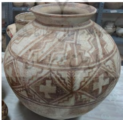
تصویر (۷) - نماد صلیب، جام سفالی، شهر سوخته، هزارهٔ ۳ ق.م.

نقش دیگر مهرمت یا محرمات است (تصویر ۹) که قدمت آن به زمانی می‌رسد که دعاها را به صورت شکل نگار بر روی نوارهای چرمی می‌نوشتند و به بازو می‌بستند یا به گردن می‌آویختند. چنین رسمی تا دوره اسلامی و سده‌های اخیر، حتی تا امروز در میان ایرانیان البته با اشکالی تعدیل‌یافته و مثلاً به صورت نوشتن دعا بر روی لباس و آویختن دعا به منظور جلوگیری از چشم‌زخم کمابیش ادامه یافته است.