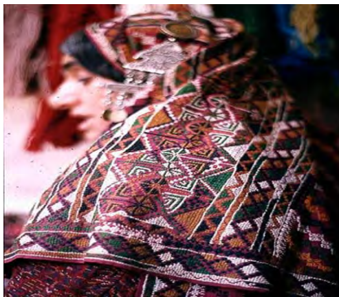
تصویر (۸) - نماد مثلثی زایش در دو طرف سریند

نقش محرمانه عبارت است از تکرار نوارهایی در کنار هم که با حاشیه‌هایی باریک از هم جدا و مشخص می‌شوند (حصوری، ۱۳۸۸: ۵۱). مهرماتک می‌تواند اشکال و رنگ‌های متنوعی داشته باشد و به صورت نوارهای عمودی، افقی یا مورب طراحی شود. کهن‌ترین اثر به‌دست‌آمده از این نماد به اواخر هزاره سوم پیش از میلاد مربوط می‌شود و در کتیبه‌های مصری به وجود چنین طرح‌هایی بر روی لباس ایرانیان اشاره شده است (همان، ۱۳۸۸: ۴۷). این طرح همچنین بر روی ظروف یونانی هم‌عصر با هخامنشیان - که لباس ایرانیان را در آن دوره نشان می‌دهد - و بر روی آثار سفالینه طبرستان مربوط به سده‌های ۴ - ۵ هجری نیز وجود داشته است. در حال حاضر می‌توان آن را بر روی فرش‌هایی که در مناطق مختلف ایران بافته می‌شوند، از جمله کردستان، بلوچ، قم، تبریز و فارس (قشقایی) مشاهده کرد.