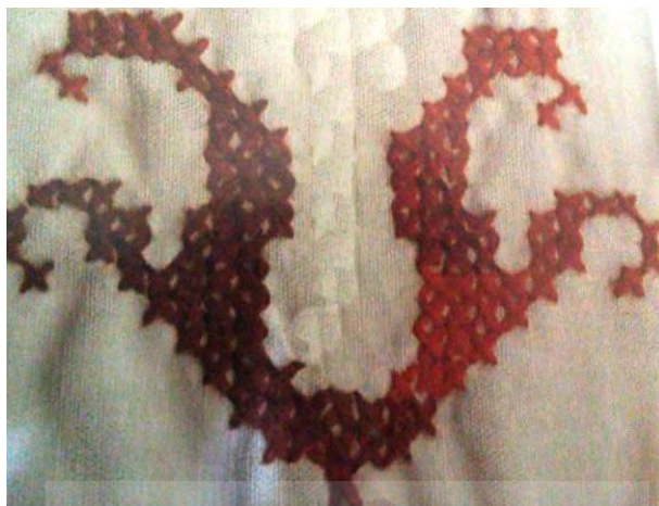
تصویر (۶) - نقش صلیب در فرش دست‌بافت سنگسری

نقش دیگر مهرمت یا محرمات است (تصویر ۹) که قدمت آن به زمانی می‌رسد که دعاها را به صورت شکل نگار بر روی نوارهای چرمی می‌نوشتند و به بازو می‌بستند یا به گردن می‌آویختند. چنین رسمی تا دوره اسلامی و سده‌های اخیر، حتی تا امروز در میان ایرانیان البته با اشکالی تعدیل‌یافته و مثلاً به صورت نوشتن دعا بر روی لباس و آویختن دعا به منظور جلوگیری از چشم‌زخم کمابیش ادامه یافته است.