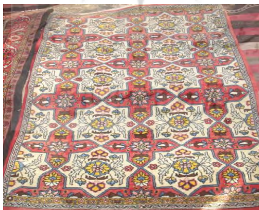
تصویر (۵) - نقش جام مهر در هنر سوزن‌دوزی

نماد کهن دیگری که در آثار بافته و سوزن‌دوزی مردم سنگسر وجود دارد و قدمتش به پیش از آیین مزدایی می‌رسد، نماد باروری است که در قالب نقوش مثلث به‌عنوان نمادی از مادینگی و اهمیت نقش مادر در تولید نسل خودنمایی می‌کند. شاید یکی از دغدغه‌های مهم جوامع کهن مادرتبار و همچنین برخی از جوامع سنتی در حال حاضر، ازدیاد نسل با هدف امرار معاش و ادامه زندگی بوده است و حس درونی نیاز به تناسل، به شکل این نماد، تجسم یافته است (همان، ۴۱). این نقش در آثار سنگسری در حواشی و گاه در متن دست‌بافته‌ها دیده می‌شود (نک: تصویر ۸).