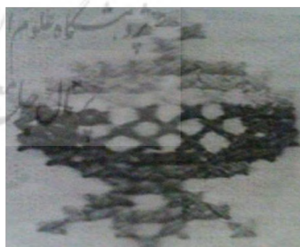
تصویر (۱) - نقش انار در آثار سوزن‌دوزی سنگسری تصویر (۲) - نقش خروس در آثار سوزن‌دوزی سنگسری