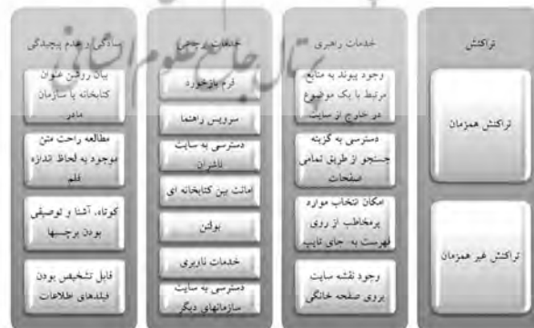
شکل ۲. معیارهای جذابیت وب

به منظور تعیین وضعیت ویژگی جذابیت وب در کتابخانه‌های دیجیتالی مورد بررسی، ۴ معیار فرعی تراکنش، خدمات راهبری، خدمات ارجاعی، و سادگی و عدم پیچیدگی در وبگاه آنها در شکل ۲، مورد بررسی قرار گرفته است. گاه علوم انسانی و مطالعات فرهنگی