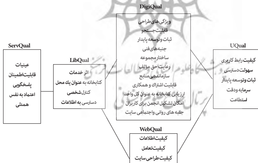
شکل ۱. سیر تکاملی پروتکل‌های ارزیابی کیفیت خدمات نظام‌های اطلاعاتی کتابخانه‌های دانشگاهی و پژوهشی

با توجه به اهمیت ارزیابی و بازبینی و بازنگری در طرح‌ها، نظام‌ها، خط‌مشی‌ها، خدمات، برای دستیابی به کتابخانه دیجیتالی پویا و کارآمد، لازم است این ارزیابی به تمام جنبه‌های این کتابخانه‌ها (محتوا، ساختار، و خدمات) بپردازد و با استفاده از تدابیری صحیح و در چارچوب معیارهایی معین صورت گیرد. بنابراین این پژوهش با استفاده از پروتکل دیجی کوال ۱ ، به تعیین کیفیت محتوا، ساختار و خدمات کتابخانه‌های دیجیتالی مؤسسه‌های پژوهشی ایران پرداخته است. پروتکل دیجی کوال توسط انجمن کتابخانه‌های پژوهشی ۲ توسعه یافته و معیارهای موجود در آن مشابه معیارهای پروتکل لایب کوال ۳ (ابزار ارزیابی کیفیت خدمات کتابخانه‌های سنتی) است. اساس هر دوی اینها، سرو کوال ۴ (ابزار برای اندازه‌گیری شکاف میان انتظارات کاربران و کیفیت خدمات) است. با پیروی از فرایند تدوین و شکل‌گیری کیفی و کمی لایب کوال که طی چهار سال (از ۲۰۰۰ تا ۲۰۰۳) به استاندارد دی تکامل یافته، مقیاس پذیر و مبتنی بر وب برای سنجش کیفیت خدمات کتابخانه‌های سنتی تبدیل شد، می‌توان برای توسعه پروتکل دیجی کوال به مدلی استاندارد برای ارزیابی انواع کتابخانه‌های دیجیتالی نیز تلاش کرد (برای درک سیر تحول پروتکل‌های ارزیابی نگاه کنید به شکل ۱).