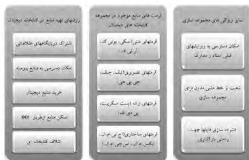
شکل ۳. ارزیابی مجموعه سازی در کتابخانه های دیجیتالی

بر اساس داده ها، فرمت متنی رایج در میان کتابخانه های دیجیتالی، به استثنای شرکت صنایع الکترونیک ایران، یونی کد است. همه کتابخانه ها از فرمت نمایشی پی.دی.اف.ا، استفاده می کنند. سه کتابخانه دیجیتال تبیان، اهل بیت و مؤسسه تحقیقات ارتباطات و فناوری اطلاعات از فرمت های ساختاری، فرمت اچ.تی.ام.ال.ا، چهار کتابخانه ایکس.ام.ال.ا و یک کتابخانه؛ شرکت صنایع الکترونیک ایران هر دو فرمت را پشتیبانی می کنند. شرکت صنایع الکترونیک ایران تنها کتابخانه ای است که امکان دسترسی به ویرایش های قبلی مدارک را برای کاربران فراهم می سازد. همه کتابخانه ها خط مشی مدون مجموعه سازی دارند و در تهیه مجموعه، نیازهای اطلاعاتی کاربران و اهداف سازمان مادر را در نظر می گیرند. شرکت صنایع الکترونیک ایران، شهرک تحقیقاتی اصفهان و مؤسسه تحقیقات ارتباطات و فناوری اطلاعات برخی فایل های خود را به منظور سهولت بارگذاری، فشرده می سازند.