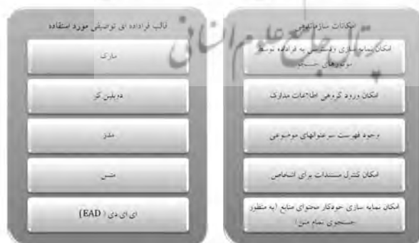
شکل ۴. ارزیابی سازماندهی در کتابخانه های دیجیتالی

در شکل ۴، برای تعیین وضعیت سازماندهی کتابخانه های دیجیتال، ابتدا به قالب فراداده ای توصیفی مورد استفاده آنها پرداخته و سپس با معیاری فرعی، وجود یا عدم وجود تعدادی از امکانات سازماندهی را بررسی کرده ایم.