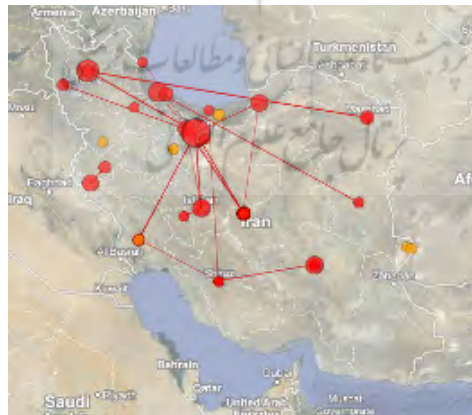
تصویر ۵. توزیع جغرافیایی انتشارات علمی در حوزهٔ موضوعی چای در ایران

انتظار می‌رود به دلیل ماهیت چای پروری مناطق شمالی کشور، تجمع تولیدات علمی در این نواحی بیشتر باشد. تصویر ۵ نشان‌دهندهٔ تجمع تولیدات علمی در استان‌های تهران و آذربایجان شرقی به‌ویژه شهرستان تبریز است. با تحلیل عنوان و چکیدهٔ تولیدات علمی گردآوری شده در این حوزه می‌توان مشاهده کرد که در بیش از نیمی از این تولیدات علمی هیچ اشاره‌ای به منطقهٔ جغرافیایی مورد مطالعهٔ تحقیق نشده است و از ۸۷ مقالهٔ مورد بررسی، ۶۸ مقاله یعنی حدود ۷۸/۱۶ درصد، به جغرافیای مورد بررسی تحقیق خود اشاره نکرده‌اند و تنها ۱۹ مقاله، یعنی ۲۱/۸۳ درصد مناطق شمالی کشور و سایر نواحی جغرافیایی را به‌عنوان جغرافیای مورد بررسی تحقیق خود برگزیده‌اند. لازم به ذکر است که از این تعداد ۱۳ مقاله (۶۸/۴۲ درصد) مناطق شمالی کشور را به‌عنوان جغرافیای هدف برای انجام تحقیق خود در حوزهٔ چای برگزیده و جغرافیای بهره‌مندی تنها ۶ مقاله (۳۱/۵۷ درصد) مربوط به سایر نواحی کشور بود. بنابراین، می‌توان نتیجه گرفت که تلاش در جهت انجام تحقیقات علمی در حوزهٔ موضوعی چای بیشتر در مناطق شمالی کشور است و این مهم نشان‌دهندهٔ وجود رابطهٔ مستقیم میان بهره‌گیری از قابلیت‌های جغرافیایی موجود در شمال کشور و تولید انتشارات علمی در این منطقه می‌باشد. اما در حالت کلی، به‌دلیل حجم بسیار زیاد تولیدات علمی بدون توجه به منطقهٔ جغرافیای خاص، رابطهٔ مستقیمی میان قابلیت‌های جغرافیایی و توزیع تولیدات علمی در این حوزه مشاهده نمی‌شود.