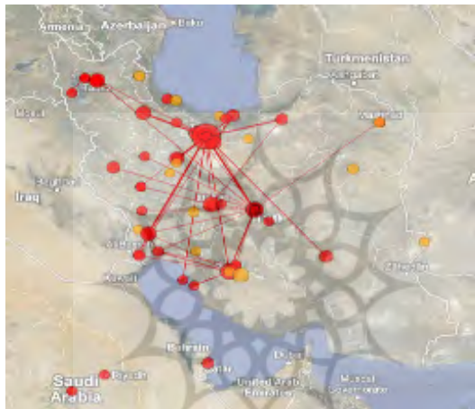
تصویر ۹. توزیع جغرافیایی انتشارات علمی در حوزه موضوعی چاه نفت در ایران

قابلیت‌های نفتی موجود در کشور، همگون ارزیابی می‌شود. همان‌گونه که در نقشه ۹ نیز قابل مشاهده است، بیشترین تراکم تولیدات علمی در استان‌های خوزستان و تهران بوده است. بیشترین تراکم در استان خوزستان ناشی از بیشترین حضور شرکت‌های نفتی در این استان بوده است. در عین حال، دانشگاه‌های صنعت نفت نیز تنها در دو استان تهران و خوزستان و شهر محمودآباد در شمال کشور پراکنده شده‌اند. پس، با وجود تجمع این امکانات و قابلیت‌ها در استان‌های تهران و خوزستان، تولید بیشتر انتشارات علمی در این استان‌ها نیز دور از ذهن نخواهد بود.