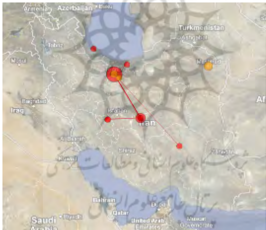
تصویر ۴. توزیع جغرافیایی انتشارات علمی در حوزه موضوعی بیماری تب شالیزار در ایران

انتظار می‌رود که مناطق غربی و مرکزی سواحل دریای خزر به دلیل شرایط خاص آب‌وهوایی و شیوع این بیماری در این حوزه فعال تر باشند. تصویر ۴ نشان‌دهنده مرکزیت استان تهران در تجمع تولیدات علمی در این حوزه است. در عین حال، پیوند قوی میان تولیدات علمی استان‌های تهران و گیلان که به عنوان مرکز تجمع تولیدات علمی و منطقه مستعد جغرافیایی در تجمع این بیماری شناخته شده‌اند، نشان‌دهنده توجه به بهره‌برداری از قابلیت‌های منطقه و جغرافیای تولید علم در این حوزه است.