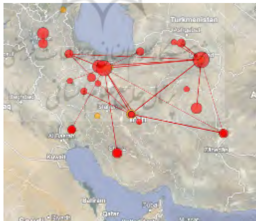
تصویر ۶. توزیع جغرافیایی انتشارات علمی در حوزهٔ موضوعی زعفران در ایران

انتظار می‌رود تجمع تولیدات علمی بیشتر در نواحی شرقی و مرکزی کشور به‌ویژه استان خراسان رضوی باشد. تصویر ۶ نشان‌دهندهٔ تجمع تولیدات علمی در شهر مشهد بوده و استان تهران برای اولین بار در جایگاه دوم قرار دارد. این مطلب نشان‌دهندهٔ رابطهٔ مستقیم میان توجه به قابلیت منطقه‌ای در تولید این محصول و توزیع تولیدات علمی آن است. تحلیل محتوایی نشان می‌دهد که در ۸۵ مقاله، حدود ۷۲/۰۳ درصد، هیچ اشاره‌ای به منطقهٔ جغرافیایی مورد مطالعه تحقیق نشده است و تنها ۳۳ مقاله، یعنی ۲۷/۹۶ درصد جغرافیای مورد بررسی تحقیق خود را ذکر کرده‌اند که بیشتر آنها نیمهٔ شرقی کشور را به‌عنوان جغرافیای بهره‌مندی خود مشخص نموده‌اند و از این تعداد، تنها ۴ مقاله سایر مناطق کشور را به‌عنوان جغرافیای هدف برگزیده‌اند. پس، می‌توان نتیجه گرفت که تلاش در جهت انجام تحقیقات علمی در حوزهٔ موضوعی زعفران در نیمهٔ شرقی کشور، به‌ویژه استان خراسان رضوی بیش از سایر مناطق در کشور است. این مهم نشان‌دهندهٔ وجود رابطهٔ مستقیم میان بهره‌گیری از قابلیت‌های جغرافیایی موجود در نیمهٔ شرقی کشور و تولید انتشارات علمی در این منطقه است. به‌عبارت دیگر، نوعی همگونی در توزیع تحقیقات علمی در این حوزهٔ موضوعی با توزیع قابلیت‌های جغرافیایی موجود در این منطقه برای انجام تحقیقات مربوطه وجود دارد.