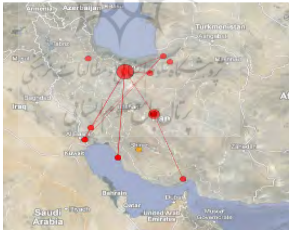
تصویر ۲. توزیع جغرافیایی انتشارات علمی در حوزه موضوعی آلودگی دریایی در ایران

کشور ایران و به دلیل مجاورت با دریا فعال‌تر باشد. تصویر ۲ توزیع جغرافیای مؤلفان مقالات و در نتیجه، انتشارات علمی این حوزه را به صورت متمرکز در استان تهران نشان می‌دهد. احتمالاً علت این تمرکز، وجود مؤسسه ملی اقیانوس‌شناسی در این استان است که البته قرار گرفتن این مؤسسه در استان تهران خود جای بحث دارد. همچنین، تحلیل محتوای تولیدات علمی نشان می‌دهد که در بیشتر تولیدات علمی به منطقه جغرافیایی مورد مطالعه تحقیق اشاره شده است. به عبارت دیگر، از ۲۵ مقاله علمی مورد بررسی در این تحقیق، ۱۸ مقاله یعنی ۷۲ درصد به جغرافیای مورد بررسی تحقیق خود اشاره داشته‌اند. از این تعداد، ۱۲ مقاله یعنی حدود ۶۶/۶۶ درصد به مبحث آلودگی در سواحل جنوبی و ۴ مقاله یعنی حدود ۲۲/۲۲ درصد به سواحل شمالی و ۲ مقاله یعنی حدود ۱۱/۱۱ درصد به هر دو منطقه ساحلی موجود در کشور پرداخته‌اند. این در حالی است که تنها ۷ مقاله یعنی ۲۸ درصد از آنها به جغرافیای مورد بررسی تحقیق خود اشاره‌ای نداشته‌اند. پس، می‌توان نتیجه گرفت که تمرکز تولیدات علمی در مناطق جنوبی بیش از مناطق شمالی کشور است و تلاش در جهت انجام تحقیقات علمی در این حوزه در مناطق جنوبی کشور بیشتر است. این مهم نشان‌دهنده وجود رابطه‌ای مستقیم میان بهره‌گیری از قابلیت‌های جغرافیایی و تولید انتشارات علمی در جنوب کشور می‌باشد.