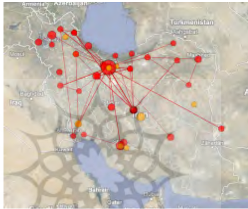
تصویر ۸. توزیع جغرافیایی انتشارات علمی در حوزه موضوعی انرژی بادی در ایران

مورد بررسی تنها ۲۵ مقاله، یعنی حدود ۱۵/۴۳ درصد در عناوین خود به مناطق جغرافیای خاص توجه داشته‌اند. اما با توجه به این مطلب که در عناوین بسیاری از تحقیقات، جغرافیای هدف مورد استفاده قرار نمی‌گیرد، نمی‌توان به صحت آمار به دست آمده اکتفا کرد و به همین دلیل، با توجه به نقشه، رابطه مستقیمی میان قابلیت‌های جغرافیای مناطق بادخیز و توزیع انتشارات علمی در نظر گرفته می‌شود. در این حوزه نیز تمرکز تولیدات علمی در استان تهران بوده است.