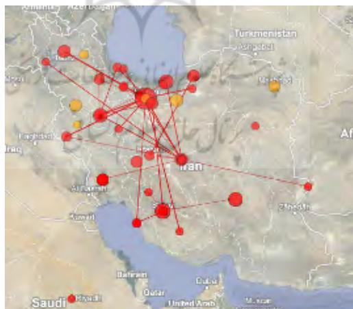
تصویر ۳. توزیع جغرافیایی انتشارات علمی در حوزه موضوعی بیماری تب مالت در ایران

انتظار می‌رود که مناطق شمالی و شمال غربی کشور به دلیل ماهیت دامپروری و وجود بیماری‌های مشترک بین انسان و دام در تولیدات علمی این حوزه فعال‌تر از بقیه مناطق باشند. تصویر ۳ نشان می‌دهد که تجمع تولیدات علمی در استان تهران، سپس در استان فارس می‌باشد. این عامل می‌تواند به علت تجمع برخی مراکز تحقیقات پزشکی وزارت بهداشت، درمان و آموزش پزشکی در حوزه موضوعی بیماری‌های مشترک بین انسان و دام در این استان‌ها باشد. از طرف دیگر، تولید بالای انتشارات علمی در استان فارس نشان‌دهنده توجه به این بیماری به عنوان مشکل بومی بوده و پیوند همکاری قوی میان استان تهران و استان آذربایجان شرقی، به‌ویژه شهر تبریز، به عنوان یکی از رکوردداران شیوع این بیماری نشان‌دهنده توجه به این بیماری به عنوان مشکل بومی در این استان است. تحلیل محتوایی مقالات نشان می‌دهد که از میان ۱۰۵ مقاله مورد بررسی، ۶۶ مقاله یعنی حدود ۸۵/۶۲ درصد، به جغرافیای مورد بررسی تحقیق خود اشاره نکرده‌اند و تنها ۳۸ مقاله (۳۶/۱۹ درصد) تحقیقات خود را در منطقه جغرافیایی خاصی پیگیری کرده‌اند. از این تعداد ۲۰ مقاله، یعنی ۵۲/۶۳ درصد نواحی شمالی و نیمه غربی کشور و ۱۸ مقاله، یعنی حدود ۴۷/۳۶ درصد از آنها سایر نواحی کشور را به عنوان جغرافیای هدف خود برگزیده‌اند.