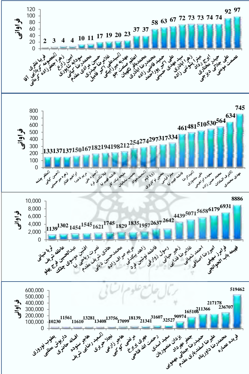
نمودار ۲. قسربندی جامعه پژوهش بر اساس مجموع میزان حضور آثار فارسی و انگلیسی در گوگل